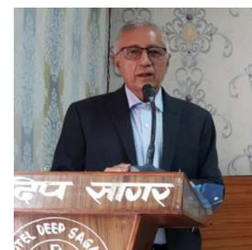
नेपाली कांग्रेसका नेता शेरबहादुर कोइराला प्रजातान्त्रिक विचार समाज कार्यकारीको नवी अधिवेशनमा ।

यसअघि जुनजुन पार्टीले जितेको छ, त्यहाँ सोही पार्टीले लिन र एमालेले जितेको पालिकामा बाँडफाँड गर्ने नेकपा माओवादी केन्द्रका अध्यक्ष पुष्पकमल दाहाल प्रचण्डको प्रस्ताव छ । सोही प्रस्तावमा टेकेर जाने हो भने कांग्रेसले ५८५ पालिका पाउनुपर्ने उनको तर्क छ । 'अघिल्लो पटक जुन जुन पार्टीले जितेको छ, त्यो ठाउँमा सोही पार्टीलाई दिने र एमालेले जितेको ठाउँमा दोस्रो पार्टीलाई दिने प्रस्ताव प्रचण्डजीले गर्नु भो' कोइरालाले भनेका छन्, 'यो प्रस्तावमा जाँदा ५ सय ८५ पालिका कांग्रेसलाई दिन