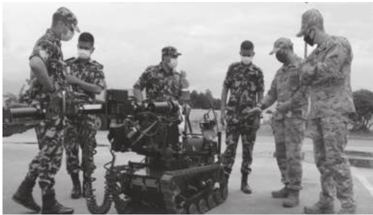
व्यालेन्स नेल चैत २० देखि वैशाख १३ गतेसम्म रेञ्जर गणको सिंह महावीर योजना तथा समन्वय महाशाखा छाउनी र रेञ्जर तालिम केन्द्र नगरकोटामा सञ्चालन हुनेछ। संयुक्त राज्य अमेरिकीका २० सैनिक र नेपाली सेनाका ९० सैनिक

काठमाडौं/मस- नेपाली सेना र अमेरिकी सेनाबीचको संयुक्त तालिम 'व्यालेन्स नेल' आजदेखि शुरु हुँदैछ। सेनाको रेञ्जर फौज र अमेरिकी सेनाको स्पेशल फौजबीच नियमित प्रक्रिया र अभ्यासका रूपमा 'व्यालेन्स नेल' हुन लागेको हो। अमेरिकी सेना र नेपाली सेनाबीच यस्तो संयुक्त अभ्यास सन् २००३ अगस्तबाट हुँदै आएको नेपाली सेनाका प्रवक्ता नारायण सिन्धुले बताए। हालसम्म व्यालेन्स नेलका ३९ वटा अभ्यास पूरा भइसकेका छन्। उनका अनुसार रेञ्जर फौजका करिब चार हजार सकल दर्जालाई यस्तो तालिम प्राप्त भइसकेको छ। प्रवक्ता सिन्धुले भने, 'यसपटकको