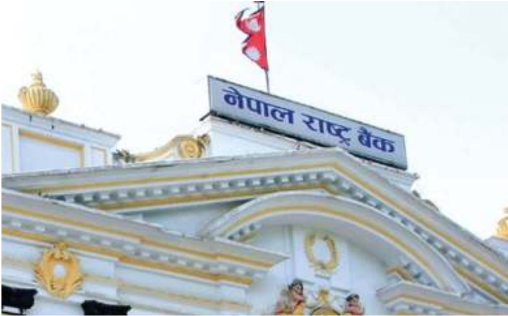
काठमाडौं/मस - काठमाडौं, १६ चैत ।

अहिले सञ्चालनमा रहेका मध्ये महालक्ष्मी लाइफ इन्स्योरेन्स, सिटिजन लाइफ, आईएमई लाइफ, रिलायबल लाइफ र सन नेपाल लाइफ इन्स्योरेन्स कम्पनीले आइपीओ जारी गरेका छन् । ति बीमा कम्पनीले आइपीओ जारी नगर्दा ति कम्पनीमा लगानी गरेका बैंक तथा वित्तीय संस्थाको नाफा प्रोभिजनमा