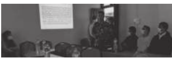
खडानन्द अधिकारी/मध्यान्ह कालिकोट, १६ चैत

कालिकोटमा विपद जोखिम न्यूनीकरणका लागि सरोकारवाला निकायबीच छलफल भएको छ। यूएसएआइ, मसीको, भकारी परियोजना, मानवअधिकार तथा वातावरण विकास केन्द्र (हरेन्डेक) र जिल्ला प्रशासन कार्यालय कालिकोटको समन्वयमा भएको कार्यक्रममा आगलागी नियन्त्रण, सुरक्षित तथा प्रभावकारिताका विषयमा छलफल भएको थियो।