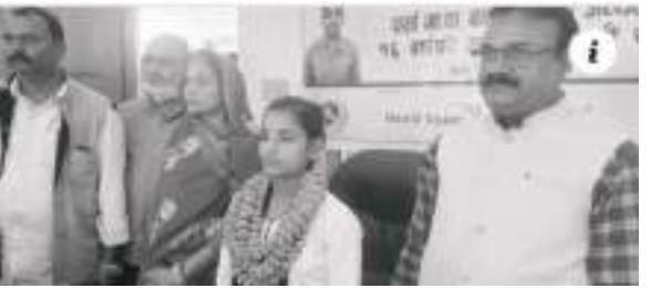
ललन कुमार चौरसिया/मध्यान्ह

सर्लाहीको पर्सा गाउँपालिकाका एक १६ वर्षीया बालिका एक दिनका लागि गाउँपालिकाको अध्यक्ष बनेकी छन्। 'अधिकारको संरक्षण हामी सबैका लागि जिम्मेवारी' भन्ने नाराका साथ जारी १६ दिने लैगिक