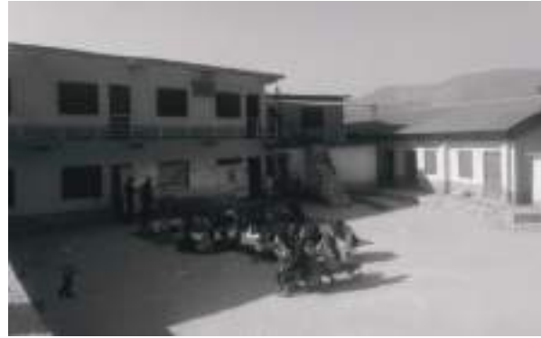
यामराज विष्ट / मध्याह्न

दौलेखको एक विद्यालयमा दुई जना प्रधानाध्यापक रहेका छन् । नारायण नगरपालिका ३ कालिमाटीस्थित नेपाल राष्ट्रिय माध्यमिक विद्यालयमा दुई जना प्रधानाध्यापक परिवर्तन गरेको जनाइएको छ ।