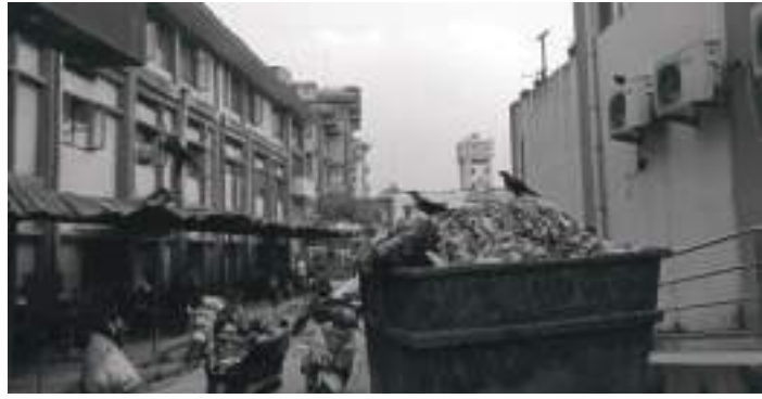
गन्धका कारण काग र कुकुरले बोकेर अन्यत्र लाने गरेको छ। अस्पतालले

अस्पतालबाट निस्कने महिलाले प्रयोग गर्ने प्याडजन्त्य पदार्थ खुल्ला रूपमा कन्टेनरमा फ्याके गरिएको छ। खुल्ला कन्टेनरमा व्यवस्थापनका लागि फ्याकिएको उक्त प्याड, गज, कपासको डंगुर कुहिएको रगतको