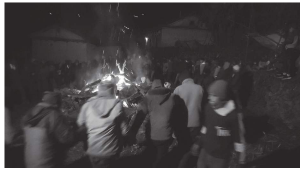
देवराज पाध्याय/मध्यान्ह बाजुरा, १९ पुस

रुपमा गिति भाकाको माध्यामद्वारा सुसूचित गर्ने गरेको पाइन्छ।