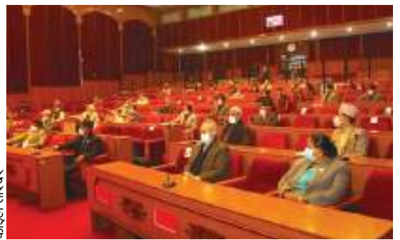
काठमाडौँ, १९ पुस ।

आजामी माघ १२ गते हुने राष्ट्रियसभा सदस्य निर्वाचनका लागि दलहरूले उम्मेदवार तय गरेका छन् । विपक्षी एमाले पक्षले १२ उम्मेदवार तय गरेको छ भने गठबन्धनका दलहरूले भागजण्डामा उम्मेदवारको निर्णय लिएको छ ।