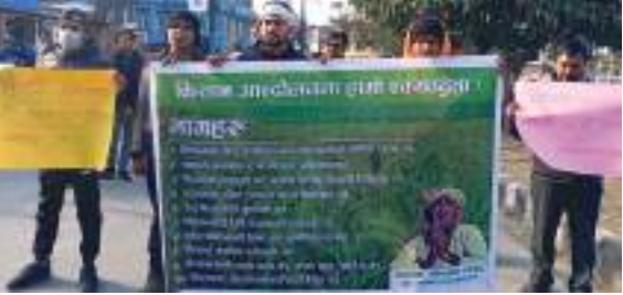
नारायण अर्याल/मध्याह्न काठमाडौं, १९ पुस

सरकारले उखुको न्यूनतम समर्थन मूल्य नतोकेपनि कतिपय किसानहरूले उद्योगलाई उखु बेच्न थालेका छन् । सरकारको प्रतिक्षा गरेर बस्दा उखु सुक्ने डरले पिरोलेको छ । सर्लाहीमा रहेका ३ वटा उद्योग मध्ये २ महालक्ष्मी सुगर मिल र इन्डुशंकर घिनी उद्योग सञ्चालनमा आइसकेका छन् ।