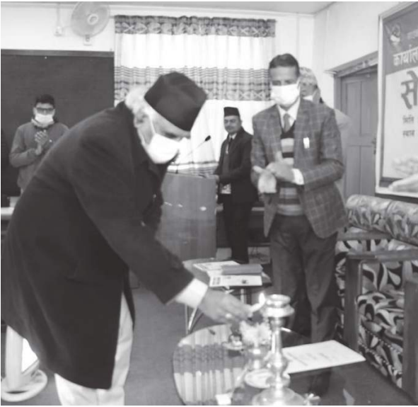
मध्यान्ह संवाददाता पोखरा, १८ पुस।