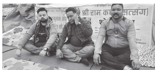
पवन जायसवाल/मध्यान्ह बाँके, १९ पुस

पितासँग गर्ने व्यवहार लगायतको बारेमा श्रीराम कथाबाट सिक्न सकिने र राम कथाले आ-आफ्ना कर्तव्य के हो? त्यसको सन्देश दिने उद्देश्यका साथ श्रीराम कथाको आयोजना गरिएको अध्यक्ष वैश्वले बताए।