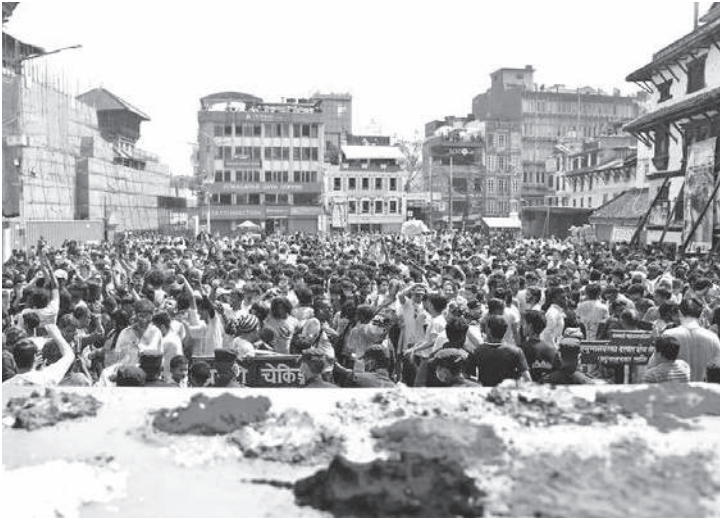
तयार भए ।

फागु पूर्णिमा पर्व आज मनाइँदैछ । प्रत्येक शुक्ल पूर्णिमाको दिन फागु पूर्णिमा होली मनाइँन्छ । आज काठमाडौं उपत्यकासहित पहाडी तथा हिमाली क्षेत्रमा फागु पूर्णिमा परेको छ । यस्तै फागुन २३ गते तराई तथा मधेस क्षेत्रमा होली मनाइनेछ । पहिले पहाडी क्षेत्रमा होली खेल्ने चलन थिएन तर अहिले सबै क्षेत्रमा खेल्न थालिएको छ । आजको दिनमा विशेष रूपमा बालबालिकादेखि वृद्धवृद्धाले उत्सवका रूपमा एक आपसमा रङ, अखिर लगाइदिने, नाच गान गर्ने र मिठो परिकार बनाएर खाने र खुवाउने गरेर हर्षोल्लासका साथ मनाउने परम्परा रहेको छ । किम्वदन्तीका अनुसार त्रेता युगमा नास्तिक हिरण्यकश्यपु नाम एक कुर राक्षस थिए ।