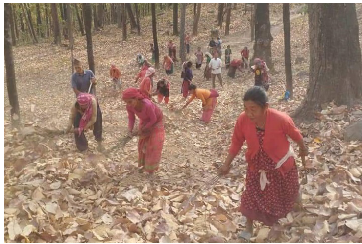
वनमा आगो लागे बस्ती र बालीजालीमा नपुगेसु भनेर पातपत्तिका हटाउँदै अर्घाखाँचीको डोहोटेका स्थानीयहरू ।