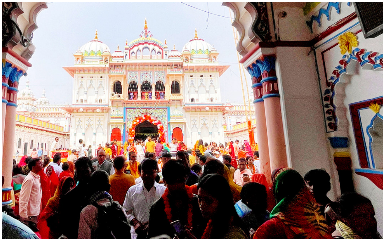
राम नवमीको अवसरमा बुधवार जनकपुरधामस्थित हिन्दूहरूको आस्थाको केन्द्र जानकी मन्दिरमा मङ्गलजन ।