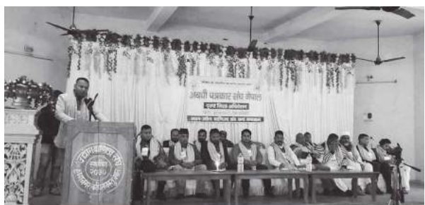
कपिलवस्तु १२ माघ