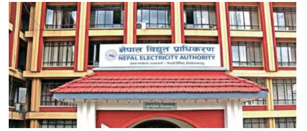
रमेश लम्साल/रासस काठमाडौं, २१ साउन।

नेपाल विद्युत् प्राधिकरणले लामो समयदेखि विवादमा फसेको डेडिङकेट तथा टुंकलाइनको महसुल विवाद समाधानका लागि पुनरावलोकनमा आउन उद्योगी तथा व्यवसायीलाई आग्रह गरेको छ। उर्जा, जलस्रोत तथा सिंचाई मन्त्रालयको निर्देशनपछि उद्योगी तथा व्यवसायीलाई छलफलमा बोलाएको प्राधिकरणले पुनरावलोकनमा आउन वा विद्युत् नियमन आयोगमा जान सुझाव दिएको छ।