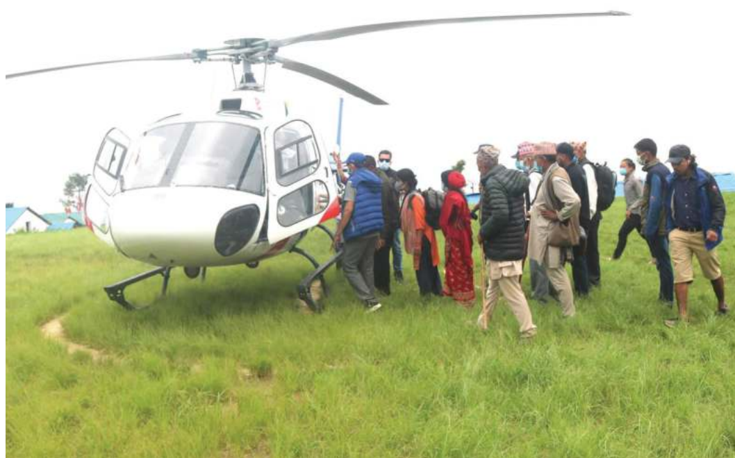
सोटाहको दिक्तेल रुपाकोट मझुवागाडी नगरपालिका-७ दोर्पा थिउरी विद्यालयलाई उपचारका लागि काठमाडौं ल्याउने क्रममा ।

मुकुन्द लामिछाने/मध्यान्ह काठमाडौं, २१ साउन ।