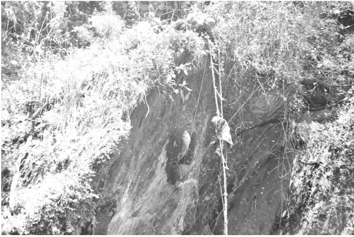
म्यादीको रघुगंगा गाजापालिका वडा नं ८ कुइनेमंगलेको पाल्तेखर्कका स्थानीयले भाइबास भिरमा मह शिकार गर्दै । भिरमा चढेर काढ्ने मह विक्रीबाट स्थानीयले आयआर्जन गर्ने गरेका छन् ।