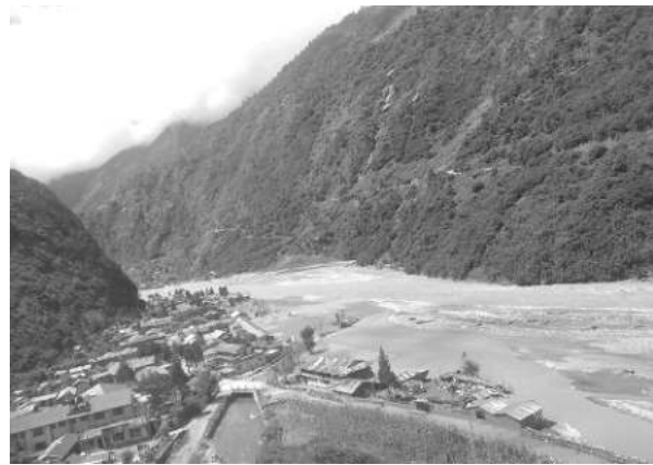
नवीन लामिछाने / रासस मनाङ, २१ साउन

गत असार १ गते बाढीका कारण गाउँ नै डुबानमा परी बगर बनेको छ। गाउँ नै बगर बनेपछि त्रिपालको भरमा बस्दै आएका नासों गाउँपालिका-१ ताल गाउँका वासिन्दा पुनर्वासको पर्खाइमा छन्।