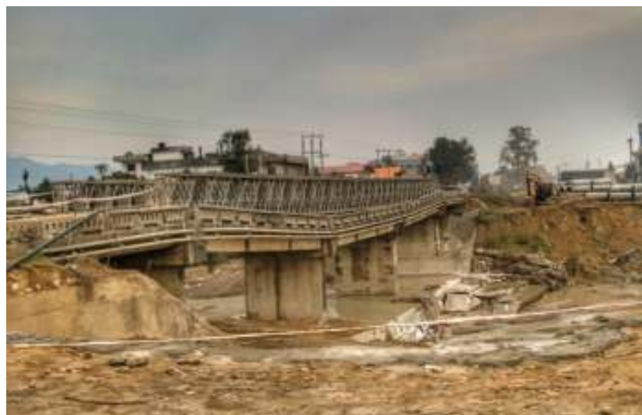
पुल जीर्ण : रूपन्देही जिल्लाको सुनवलमा अवस्थित तुरिया पुल जीर्ण अवस्थामा।

नेपाली समाजमा स्थानीय तहमा सुपुत्ररूपमा रहेका सम्भावनाहरूको पहिचान गरी त्यस्ता सम्भावनाहरूलाई उजागर गर्नको लागि सहयोगी बन्ने मूल उद्देश्यबाट निर्देशित हाम्रो विकास प्रवर्द्धन कोष मार्फत ज्योति विकास बैंकले विभिन्न सामाजिक संस्था तथा नागरिकहरूसँग प्रत्यक्ष रूपमा जोडिएर सामाजिक उत्तरदायित्व सम्बन्धी कार्यहरू गर्दै आएको छ।