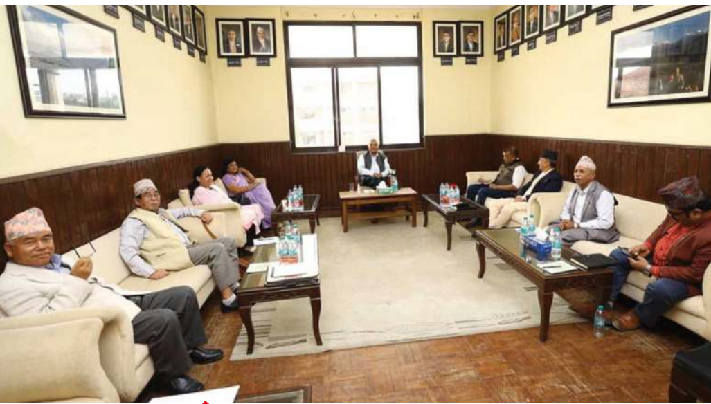
सत्ता गठबन्धनअन्तर्गतको स्थानीय निर्वाचन तयारी तथा अनुगमन समितिको बुधबार बसेको बैठकमा सहभागी नेताहरु ।

नेकपा माओवादी केन्द्रको प्रमुख आकांक्षा देखिएको चितवनको भरतपुर महानगरपालिकामा नेपाली कांग्रेस पनि आकांक्षी देखिएपछि दुबै पक्ष आफ्नो उम्मेदवारी रहने दाबी गर्न थालेका छन् । जसका कारण गठबन्धनका शीर्षस्थ नेतृत्वलाई भागवण्डा टुंग्याउन सकस परेको छ ।