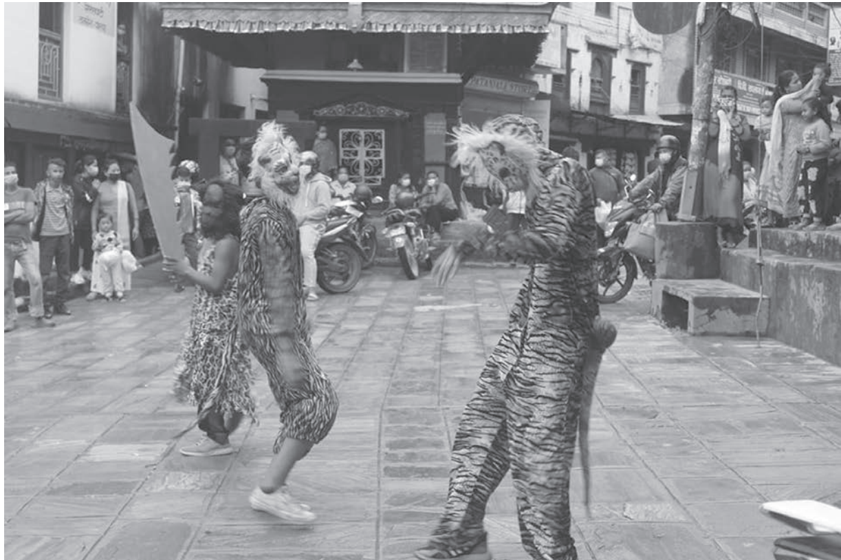
पाल्पाको तानसेनामा निकालिएको बाघजात्रा । गाजात्रादेखि एक सातासम्म विभिन्न प्रकारका जात्रा निकाल्ने चलन छ ।