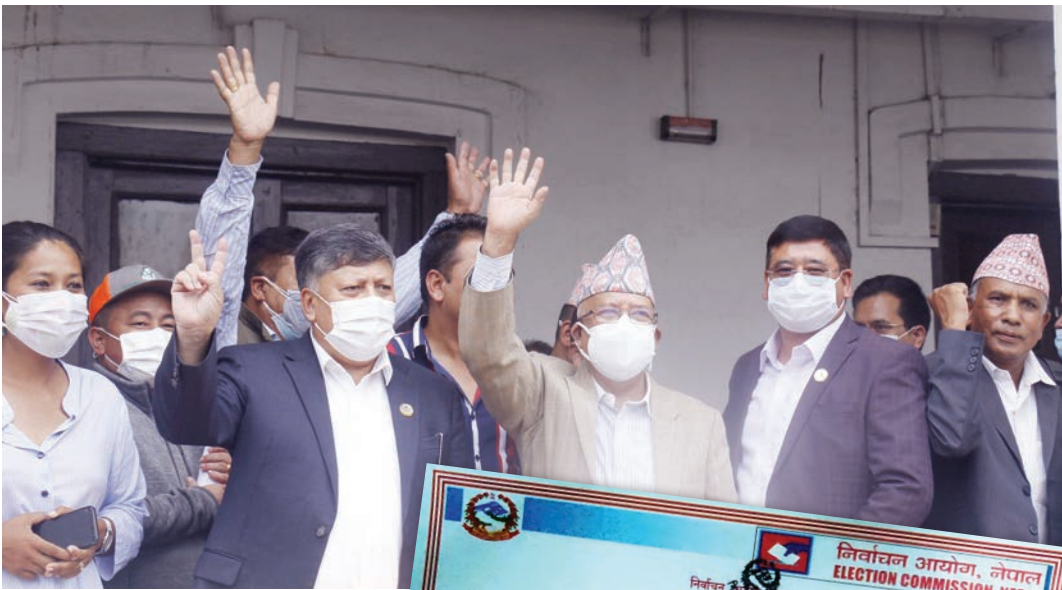
९ भदौ ।

२०३२ सालमा बनेको कोको, नेकपा माले हुँदै एमालेका रूपमा स्थापित पार्टीका संस्थापक एवम् पूर्वप्रधानमन्त्री माधवकुमार नेपाल बुधबार देखि नयाँ पार्टी नेकपा (एकीकृत समाजवादी) का अध्यक्ष बनेका छन् । १४ वर्ष नेतृत्व गरेको र आफैले हुकाएको पार्टी छोडेर माधव नेपालले नयाँ पार्टीबाट कुठि गर्नु चाहँदैन, त्यो भने भविष्यले देखाउनेछ ।