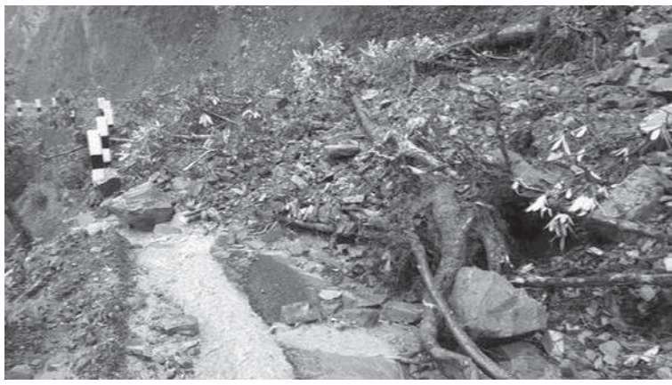
सोही सडकअन्तर्गत नुवाकोट जिल्लामा मैथली खोलामा एक महानदीखि पूर्णरूपमा सडक अवरुद्ध छ। जुम्लामा बड्कीमा र त्रिभुवन राजपथ मकवानपुर जिल्लाको नौखन्डेमा पूर्णरूपमा अवरुद्ध छ। कोदारी राजमार्ग सिन्धुपाल्चोकको लिपिङ्ग खोलामा

काठमाडौं/मस- बाढी र पहिरोका कारण पूर्णरूपमा अवरुद्ध १२ सडक अर्भै खुलेका छन्। वर्षाका कारण यस वर्ष १८२ सडक अवरुद्ध बनेकामा हाल १११ सडक एकातर्फबाट मात्रै सञ्चालन रहेको छ।