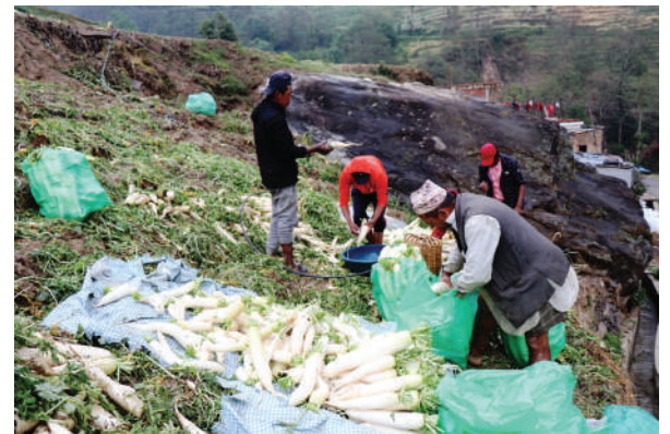
काभ्रेको बनेपा नगरपालिका-२ घिमिरे गाउँका किसान बजारमा बेच्न लैजानका लागि मूला पखालेर तयार पार्दै ।

कान्ति न्यौपाने / मध्यान्ह काठमाडौं, २९ चैत ।