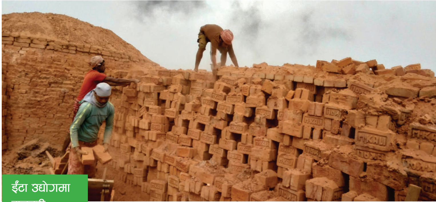
ईटा उद्योगमा मजदुरी

महोत्तरी जिल्लाको जलेश्वर नगरपालिका-४ स्थित काली ईटा उद्योगमा काम गर्दै मजदुरहरू ।