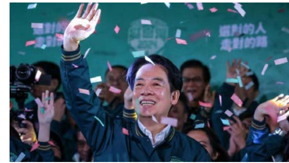
ताइवानमा चुनाव जितेपछि मतदातालाई धन्यवाद दिँदै डीडीपी नेता लाइ

ताइवानमा हालै भएको निर्वाचन र त्यसको नतिजाका सन्दर्भमा शक्ति राष्ट्रहरुको चासो प्रकट भइरहेका बेला प्रधानमन्त्री प्रचण्डले नेपाल ताइवान स्वतन्त्रताको विपक्षमा रहेको बताएका हुन् ।