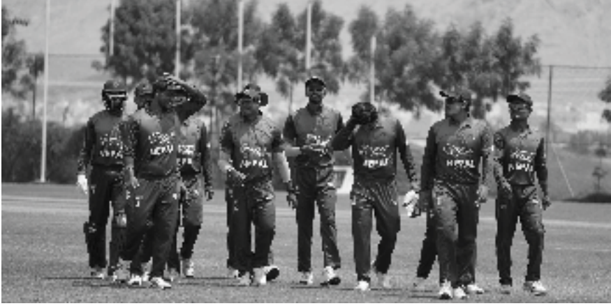
मध्याह्न संवाददाता काठमाडौं, २२ भदौ

नेपालले एकदिवसीय अन्तर्राष्ट्रिय क्रिकेटमा पपुवा न्युगिनी (पिएनजी) लाई पराजित गरेको छ। ओमानको अल अमिराल क्रिकेट मैदानमा मंगलवार भएको खेलमा नेपालले पिएनजीलाई दुई विकेटले पराजित गरेको हो।