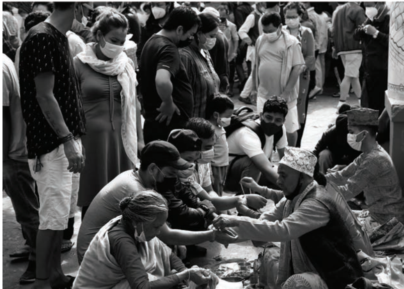
जनै पूर्णिमाका दिन आइतबार बङ्गालामुखी मन्दिर परिसरमा भक्तजनलाई डोरो बाँध्दै पुरोहित।

साथै पिछ्लो चरणको अर्को प्रसङ्ग अनुसार बलराजा सत्यवादी भएको र उनलाई पदच्युत गर्नको निमित्त विभिन्न प्रयत्न गरी विष्णु भगवानसँग पातलमा गई बसेको र स्वर्गमा उनीहरू विना सबै काम रोकिएर भद्रगो बएको हुनाले लक्ष्मीले पातलमा गई दैत्यहरूका राजा