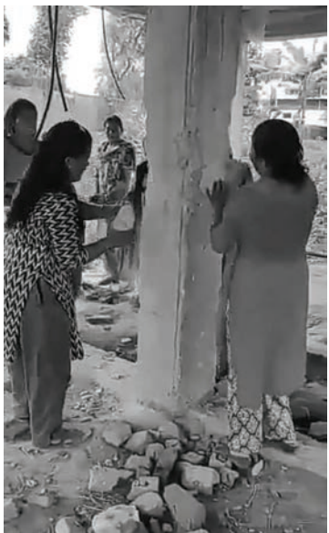
गरी भवन बनाएको भन्दै गाउँपालिका कार्यालय र इलाका प्रहरी कार्यालयमा निवेदन दिएका थिए। ती दुवै निकायमा

प्रहरीले उजुरी दर्ता नगरी छलफल गरी सहमत गराउन खोजेको सहकारीका पदाधिकारीहरू बताउँछन्। बेलडाँडी गाउँपालिकाले दुई वर्ष अघि आफ्नो स्वामित्वमा हुने गरी सहकारीलाई भवन बनाउन जग्गा उपलब्ध गराएको थियो। गाउँपालिका र सुदूरपश्चिम प्रदेश सरकारको सहयोगमा सहकारीले कार्यालय भवन बनाएको हो। अहिले दोस्रो तलाको काम अघि बढाइएको छ। कांग्रेस कार्यकर्ताले गाउँपालिकाले सहकारीलाई भवन बनाउन जग्गा दिएको विरोधमा तोडफोड गरेको सहकारीका पदाधिकारीहरूको आशंका छ। तोडफोड अघि उनीहरूले सहकारीले सार्वजनिक जग्गा अतिक्रमण