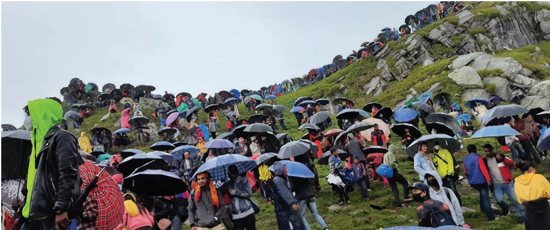
कालीकोट र दैलेखको सिमाना रहेको महावैद्यममा पूजा गर्न आएका भक्तजन ।