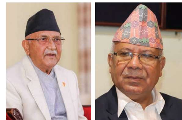
समित श्रेष्ठ/मध्याह्न काठमाडौं, ६ भदौ ।

प्रतिनिधिसभाको सर्वेभन्दा ठूलो दल नेकपा एमाले विभाजित भएर चार समूह बन्दा कार्यकर्तामा भने कता लाग्ने भन्ने ठूलो सकस देखिन्छ ।