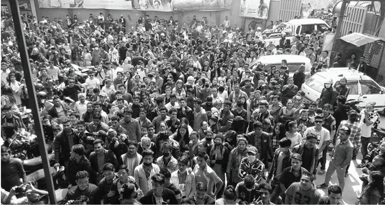
लक्ष्मण पोखरेल/मध्यान्ह काठमाडौं, ६ भदौ

विश्वव्यापीरूपमा फैलिएको कोरोना भाइरस (कोभिड-१९) संक्रमणका कारण विश्वभरिभरै फिल्म क्षेत्र प्रभावित भएको छ। कोरोना संक्रमण नियन्त्रणका लागि सरकारले जारी गरेको लकडाउन तथा निषेधाज्ञाका कारण गत वर्ष देखि नै बला