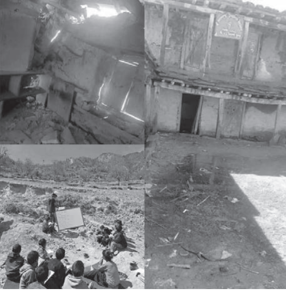
ओबराज शाही/मध्याह्न हुम्ला, २८ जेठ

एक वर्ष अगाडिको बाढीपहिरोले क्षति पुगेको विद्यालय भवन तबन्दा विद्यार्थीहरू खुला आकाश मुनि पढ्न बाध्य भएका छन्। हुम्लाको सङ्गेगाड गाउँपालिका वडा नं १ जैको भिटागाउँमा रहेको गणतन्त्र प्राथमिक विद्यालयको भवन गत वर्ष असोज १९ देखि २७ गतेसम्म अतिरिक्त वर्षासँगै आएको बाढीपहिरोमा परी भत्किएका विद्यार्थीहरू चौरमा पठनपाठन गर्न बाध्य भएका हुन्।