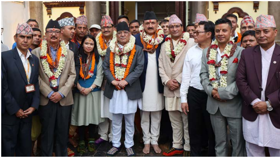
शनिबार पशुपतिनाथ पुगेका प्रधानमन्त्री प्रचण्ड मन्त्रीहरुका साथमा ।

प्रधानमन्त्रीको भ्रमणका क्रममा नेपालले प्रवृद्ध समूह (ईपीजी) को कुनै कुरा उठाउन चाहिनन् भने सीमा समस्याबारे नयाँ दिल्लीमा दिएको वक्तव्य आफैले सच्याउनु परेको थियो । दिल्लीमा नेपालको भूमि भारतसँग साटुनेबारे छलफल भएको बताएका प्रचण्डले संसदमा उभिएर भने त्यस्तो कुनै कुरा नभएको प्रष्टोक्ति दिए । प्रमुख प्रतिपक्षी दल नेकपा एमालेका सांसदहरुले चर्को आपत्ति जनाएपछि प्रधानमन्त्री प्रचण्डले कुनै त्यस्तो अभिव्यक्ति र