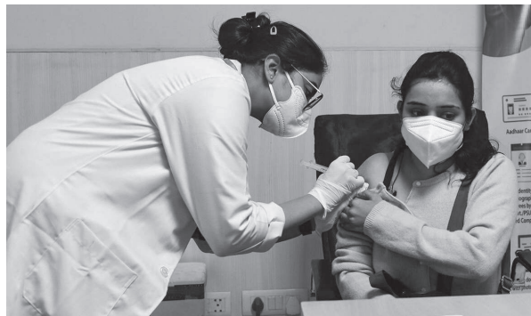
लख १७ हजार ५२२ जना नयाँ संक्रमित भएको विवरण सार्वजनिक गरिएको थियो। संक्रमितहरूको सङ्ख्या यामा साप्ताहिक रूपमा १५.५६ प्रतिशतले बढी भएको पाइएको पनि अधिकारीहरूले जनाएका छन्। भारतमा अहिले संक्रमित अवस्थामै रहेकाहरूको सङ्ख्या पनि

भारतमा कोरोनाभाइरसबाट एकैदिनमा थप ४७ हजार ५९९ प्रतिले बढी मर्ने भएकाले स्वास्थ्य मन्त्रालयले जनाएको छ। अघिल्लो दिन विहीवार सार्वजनिक गरिएको तथ्याङ्कको तुलनामा २९ हजार ७२२ बढी रहेको छ। अघिल्लो दिन भारतमा तीन