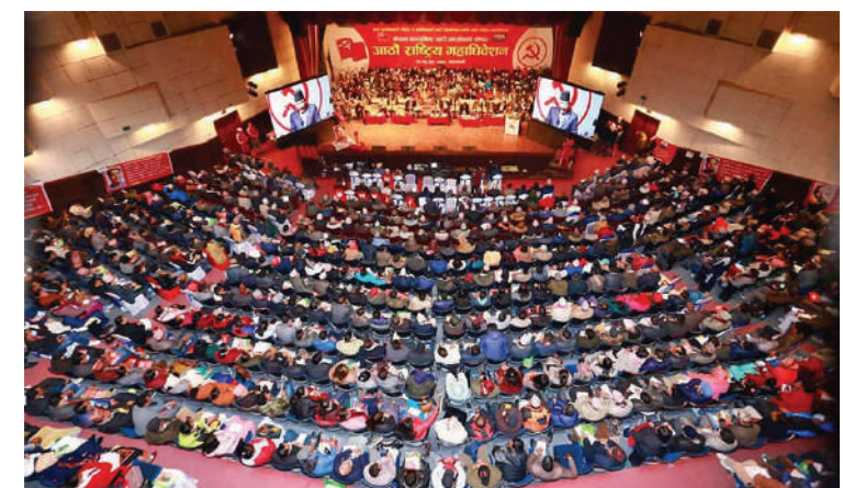
कान्ति न्यौपाने/मध्याह्न काठमाडौं, ७ माघ ।

महासचिव पदमा धेरै नेता आकांक्षी देखिनु र तिनै मध्येबाट भावी नेतृत्व (उताधिकारी) चयन हुने सक्ने अनुमानका कारण महाधिवेशन सकिएको दुई साता बिट्दा पनि माओवादी केन्द्रले पदाधिकारी टुंग्याउन सकेको छैन ।