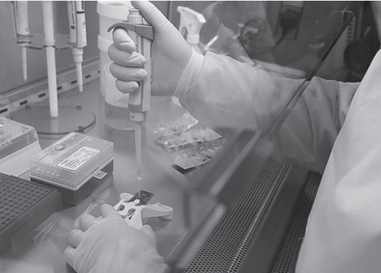
प्यूठान, १७ जेठ