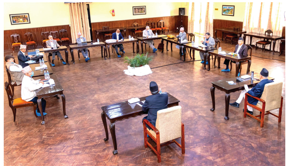
प्रधानमन्त्री निवास बालुवाटारमा शनिबार बसेको सचिवालयको बैठकमा नेपाल कम्युनिष्ट पार्टी (नेकपा) का अध्यक्ष एवं प्रधानमन्त्री केपी शर्मा ओली, अध्यक्ष पुष्पकमल दाहाल 'प्रचण्ड', वरिष्ठ नेता माधवकुमार नेपाल र फलनाथ खनाल, उपप्रधानमन्त्री ईश्वर पोखरेल, गृहमन्त्री रामबहादुर थापा, प्रवक्ता नारायणकाजी श्रेष्ठ लगायत ।