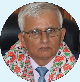
कामदारहरूको स्वाव परीक्षण गरिदिने प्रतिवद्धता जनाएको भएपनि