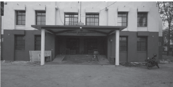
गोमती पाल/मध्यान्ह महेन्द्रनगर, ६ जेठ

भीमदत्त नगरपालिकाले भारतीय क्वारेन्टाइनमा राखिएका नेपाली नागरिकहरूलाई स्वास्थ्य जाँचपछि बासस्थानसम्म पुऱ्याउन संघ र प्रदेश सरकारसँग आग्रह गरेको छ। नगरपालिका नगर कार्यपालिकाको बैठकले स्वास्थ्य जाँच प्रक्रिया पूरा गरिएका नागरिकलाई सिधै बासस्थानसम्म पुऱ्याउन आग्रह गरेको हो।