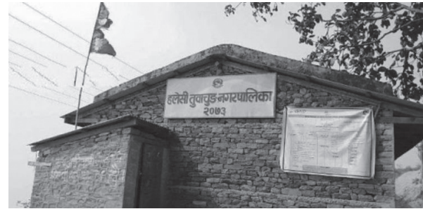
खोटाङ, ६ जेठ