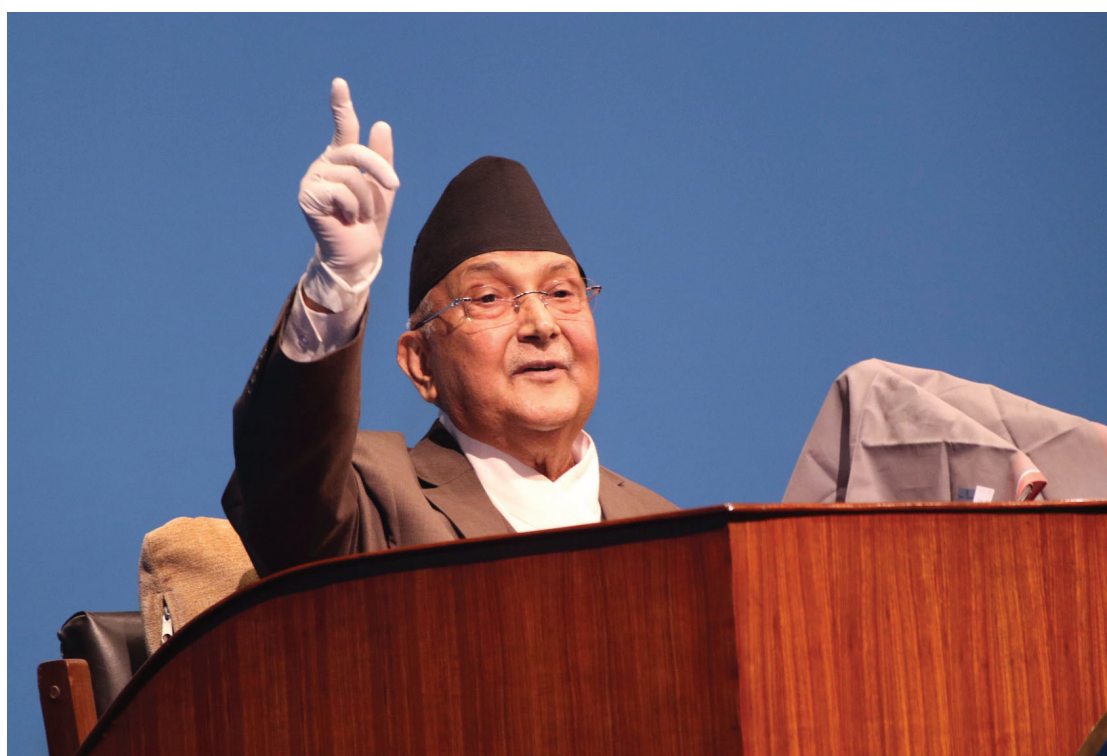
मध्यान्ह संवाददाता काठमाडौं, ६ जेठ ।

प्रधानमन्त्री केपी शर्मा ओलीले लिम्पियाधुरा सहितको नेपालको नक्सा सार्वजनिक गर्ने कार्य ऐतिहासिक भएको र नक्सा मात्रै नभएर भूमि नै फिर्ता ल्याउने दावी गरे। प्रधानमन्त्री ओलीले केही दिनभित्रै संविधानको अनुसूची संशोधन गरी नेपालको आधिकारिक नयाँ नक्सा कार्यान्वयनमा जाने घोषणा गरे।