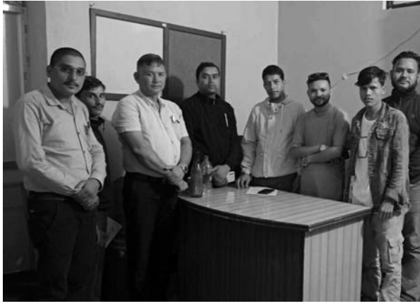
सचिवालय बैठकले महासंघले तयार पारेको उक्त मापदण्डलाई लत्याउँदै प्रेस चौतारीमा आस्था राख्ने पत्रकारहरूलाई मात्रै लक्षित गरी केही सदस्यहरूको नवीकरण नगर्ने निर्णय गरेको भन्दै आपत्ति

नेपाल पत्रकार महासंघ सुर्खेत र कर्णाली प्रदेश समितिलाई प्रेस चौतारी नेपाल, जिल्ला समिति सुर्खेतले ज्ञापन पत्र बुझाएको छ। आइतवार प्रेस चौतारीले पत्रकार महासंघ सुर्खेत र प्रदेश समितिलाई ज्ञापन पत्र बुझाएको हो। नेपाल पत्रकार महासंघ केन्द्रीय कार्यालयले महासंघलाई विशुद्ध पत्रकारहरूको संस्था बनाउनका लागि शुद्धीकरणका लागि विभिन्न १५ वटा मापदण्ड तयार गरेको छ। नेपाल पत्रकार महासंघ कर्णाली प्रदेश समितिको