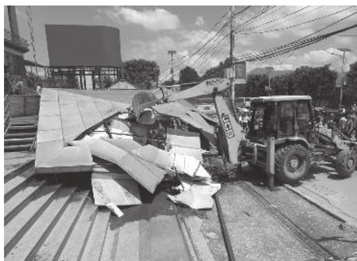
निर्माण भएका अवैध संरचना, काठमाडौं रहेको अल्लाविटामा निर्माण विपरीत मलका अवैध संरचना, आर वि कम्प्लेक्सका करिव १४ साना पसल र वानेश्वरमा रहेको अल्लाविटामा निर्माण विपरीत प्रयोग भएका संरचना भत्काइएका छन्। यही सन्दर्भमा केही दिनअघि सानो

भन्दाभन्दा रहेको अवैध सात टहरा पनि भत्काइएको छ। त्यसैगरी वल्ड ट्रेड सेन्टरमा अनधिकृत रूपमा राखिएको विद्युतीय विज्ञापन पनि हटाइएको छ। नक्सा अनुरूप निर्माण नभएको, नक्साअनुसार निर्माण भए पनि सोहीअनुसार प्रयोग नभएको र सार्वजनिक जग्गा मिचर निर्माण भएका सबै संरचना अवैध ठहर गदै काठमाडौं महानगरको नैतृत्वकर्ता सभले निर्माण विपरीत भत्काउने अठोट कामपाको छ। हाल बेसमेन्ट र अन्डरग्राउन्ड पाईकिङ राख्ने सर्तमा कर छुट लिइरहेका ३५ भवन रहेको कामपाले जनाएको छ। ती सबैलाई कानुनी दायरामा ल्याउने कामपाले जनाएको छ। कामपाले यही भदौ ६ गतेदेखि अवैध रूपमा निर्माण भएका र निर्माण भए अनुरूप प्रयोग नभएका संरचना भत्काउन थालेसँगै अन्य स्थानीय तहले पनि यसलाई अनुशरण गर्न थालेका छन्।