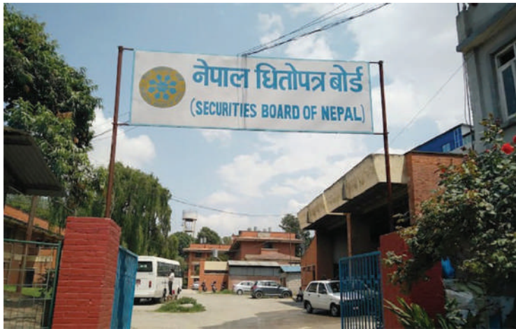
नारायण अर्याल/मध्याह्न काठमाडौं, १४ पुस ।

ब्रोकर लाइसेन्सका लागि आवेदन दिएका ४६ वटा कम्पनीले अनुमति पाउन सक्ने भएका छन् । बुधबार सर्वोच्च अदालतले धितोपत्र बजार सञ्चालन नियमावली र धितोपत्र व्यवसायी नियमावली विरुद्धको रिट सवैधानिक इजलासले खारेज गरेसँगै धितोपत्र बोर्डलाई पुरानै लाइसेन्स वितरण प्रक्रिया अघि बढाउने बाटो खुलेको हो । तथापि, सोही मुद्दामा परेको अर्को रिटको किनारा नलागेसम्म भने बोर्डले लाइसेन्स वितरणको प्रक्रिया अघि बढाउन पाउने छैन ।