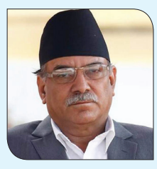
पुष्पकमल दाहाल, अध्यक्ष, नेकपा