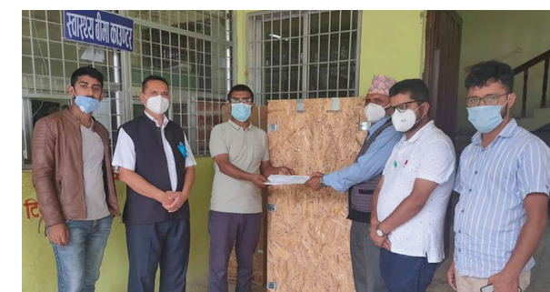
जिल्ला अस्पताल स्याङ्जालाई युनिभर्सल एनएस थिसिया विथ भेन्टिलेटर मेसिन हस्तान्तरण गरिएको छ।

बुधवार डिस्चार्ज हुनेमा जलेश्वर अस्पताल महोदरीबाट एक महिला र १८ पुरुष, कोभिड-१९ अस्पताल सपही जनकपुरबाट २० पुरुष, सिन्धुली अस्पताल सिन्धुलीबाट तीन पुरुष छन्। चितवनस्थित भरतपुर अस्पतालबाट नवलपरासी (पूर्व)का एक पुरुष र