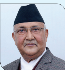
कोपी शर्मा ओली, प्रधामन्त्री

अधिल्लो सचिवालय बैठक अगाडि भण्डै पार्टी विभाजनको संघारमा पुगेको थियो। पार्टीमा अहिले पनि गुटबन्दी र बहुमतको खेल छ। यस्तो अनुशासनहीन काम किन हुन्छ ?