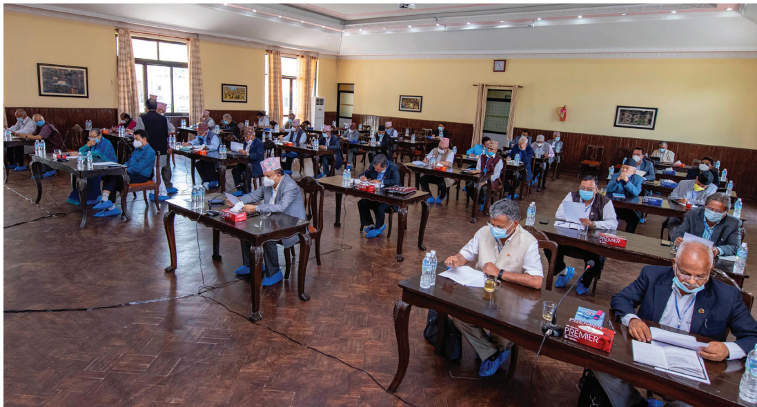
प्रधानमन्त्रीनिवास बालुवाटारमा बुधवार बसेको नेपाल कम्युनिष्ट पार्टी (नेकपा)को स्थायी कमिटीको बैठकमा सहभागी हुँदै समिति सदस्यहरू।

नेकपाभित्र सरकारको कार्यशैलीलाई लिएर असन्तुष्टि देखिएको छ। कतिपय भने गएको वैशाख ११ गते उपाध्यक्ष वामदेव गौतमको निवासमा बसेको प्रधानमन्त्री ओली इतरका नेताहरूले ओलीलाई अध्यक्ष र प्रधानमन्त्री मध्ये कुनै एक पद छोड्न दबाव दिने निर्णय समेत गरेको थियो। पार्टी र मन्त्रपरिषदका सदस्यहरू बीच नै कुनै छलफल नगरी प्रधानमन्त्री ओलीले वैशाख ८ गते दल विभाजन सम्बन्धी अध्यादेश