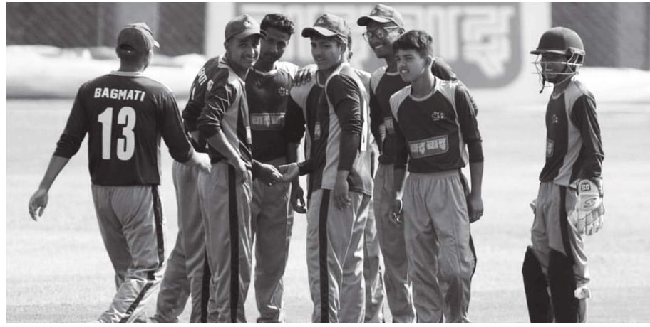
काठमाडौं/मस- यही मंसिर ७ गतेदेखि हुने यू-१९ राष्ट्रिय क्रिकेट प्रतियोगिताको तालिका सार्वजनिक गरिएको छ। नेपाल क्रिकेट संघ (क्यान)ले बिहीबार सात प्रदेशका युवा टिमको

सहभागिता रहने प्रतियोगिताको तालिका सार्वजनिक गरेको हो। सार्वजनिक तालिकाअनुसार मंसिर ७ गते पहिलो खेलमा वाग्मती प्रदेश र गण्डकी प्रदेशबीच प्रतिस्पर्धा हुनेछ। पहिलो खेल कीर्तिपुरस्थित त्रिवि क्रिकेट मैदानमा हुनेछ। प्रतियोगिताको दोस्रो दिनदेखि कीर्तिपुर र मूलपानी मैदानमा दिनको एक/एक खेल हुनेछ। प्रतियोगिताको यस संस्करणमा तीनवटै विभागीय टिमको सहभागिता छैन। चौधरी गुपको वाइवाई मुख्य प्रायोजक रहेको प्रतियोगिताको फाइनल खेल मंसिर १९ गते हुनेछ।