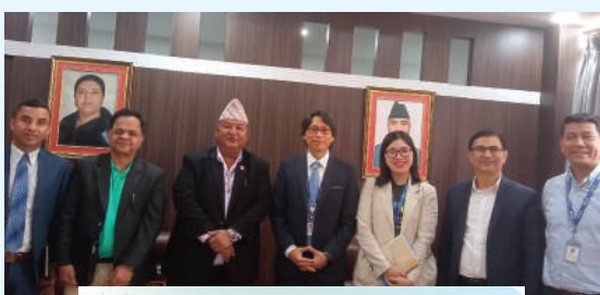
वैदेशिक रोजगार विशेष

कोरियाली अन्तर्राष्ट्रिय सहयोग नियोग (कोईका)ले उपलब्ध गराएको उक्त रकम सम्बन्ध सरकारी निकाएको