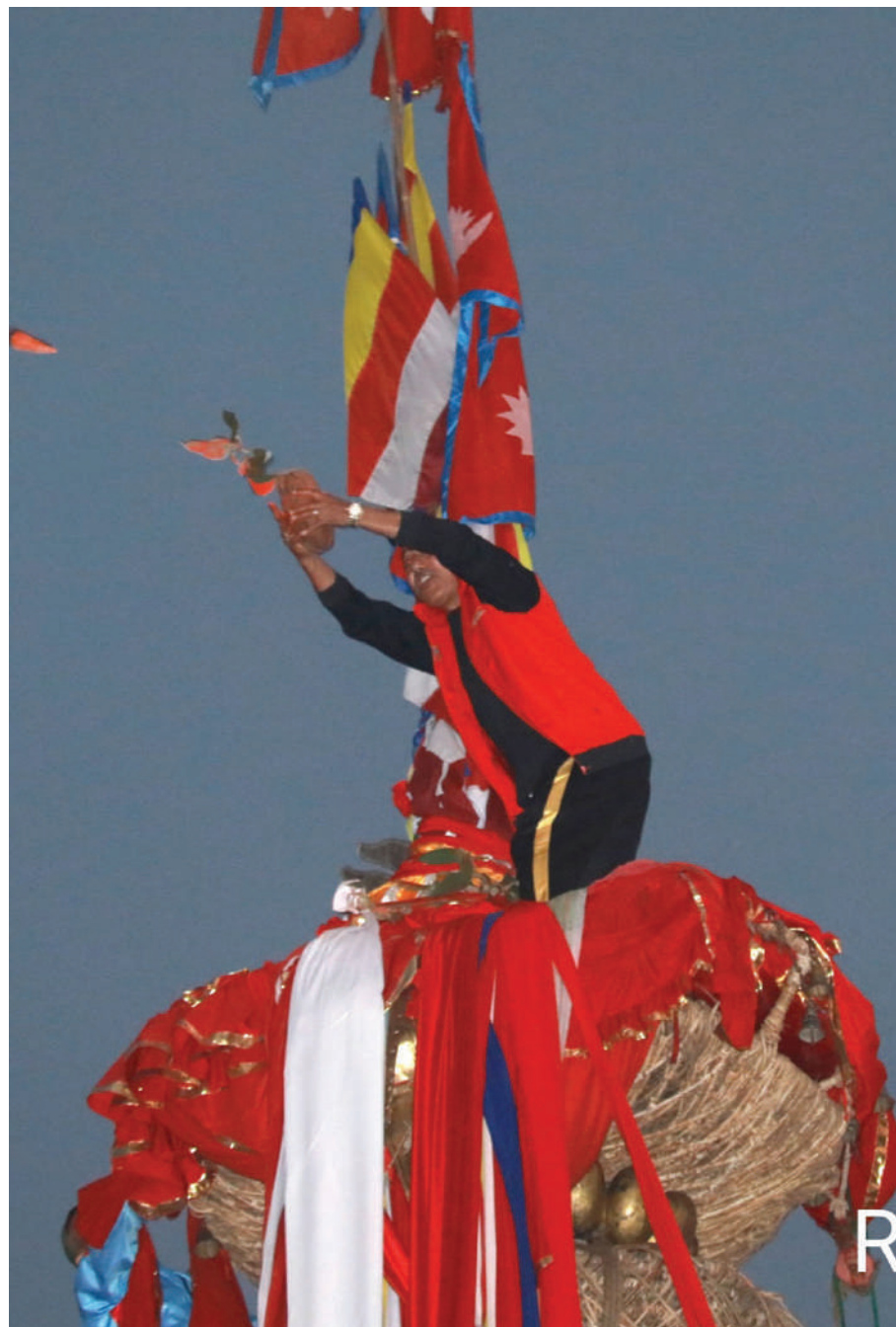
ललितपुरको प्रसिद्ध रातो मट्ठिन्द्रनाथको रथ जात्राका क्रममा मंगलबार ईतिहोला मट्ठिन्द्रनाथको ३२ हात लालो टुपाबाट जरिवला ससालदैं गुठिच्यार ।