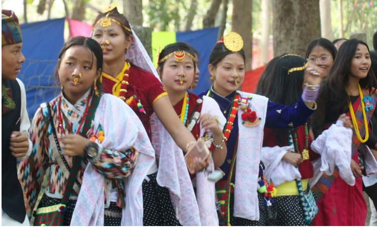
किराँत सन्तुदायको पर्व उगौली मंगलबारबाट शुरु भएको छ । उगौलीको अवसरमा धारण उपमहानगरपालिका-१७ स्थित साकेला पार्कमा साकेला सिली जाउँदै ।