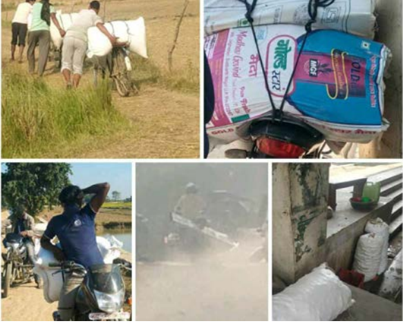
शहबाज खान/मध्याह्न काँपलवस्तु, १० पुस

काँपलवस्तुको सीमा नाकाहरूमा पछिल्लो समय पुनःतस्करी मौलाउन थालेको छ। जिल्लाको बगही, कुकुरभुक्वा, कृष्णनगर, भण्डेनगर, लक्ष्मीनगर, सिर्सिहवा, ठकुरपुर, गेडुवाजोत लगायत विभिन्न नाकाबाट तस्करी मौलाएको पत्यक्षदर्शीहरू बताउँछन्।