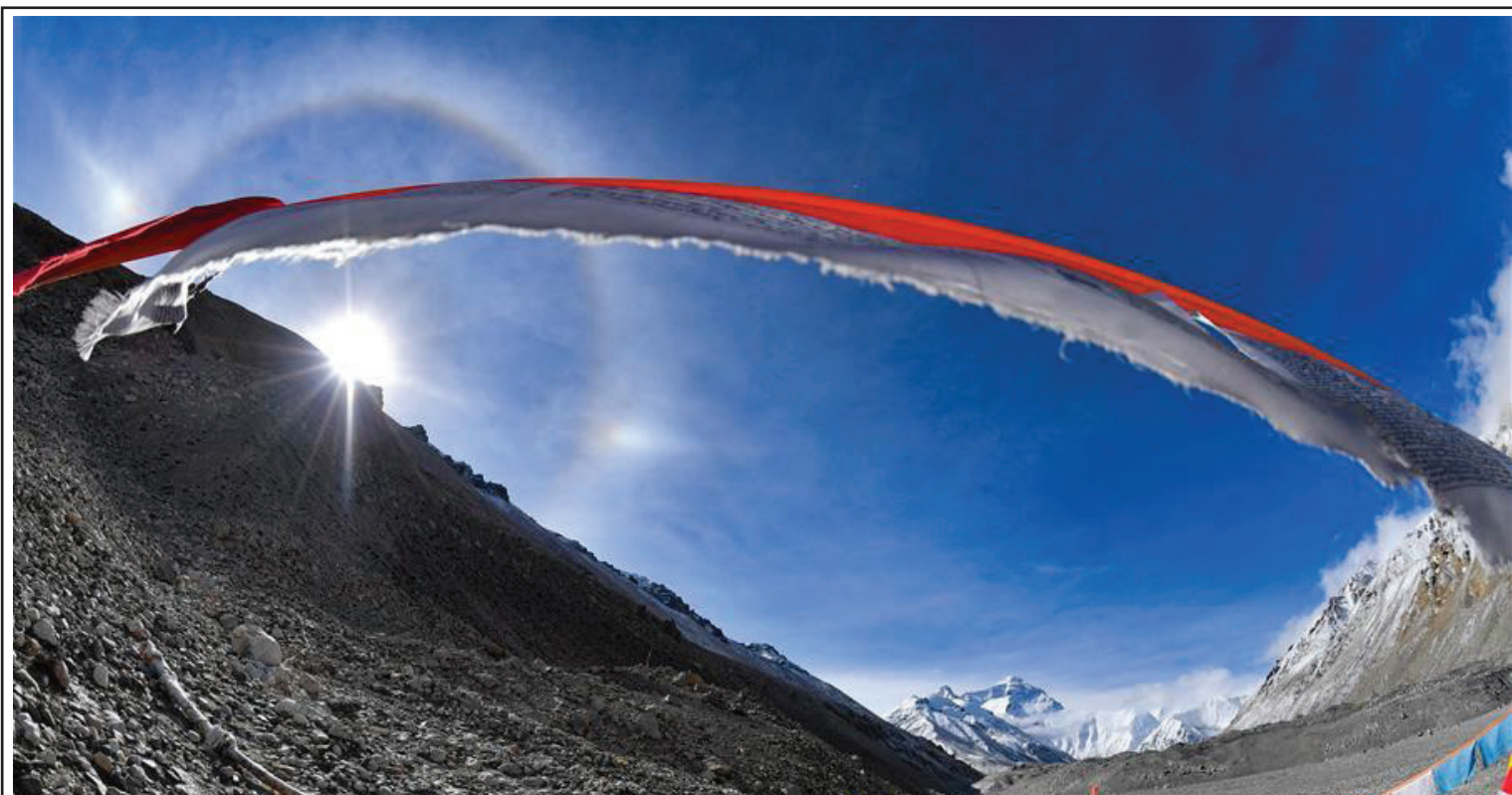
सचिवालय टोटी: चिनियाँ सरकारी सञ्चार माध्यम सीजीटीएनले यस अगाडि सगरमाथा चीनमा पर्ने टवीट सच्याएको छ। सीजीटीएनले सगरमाथा चीन-नेपालको सीमानामा पर्ने उल्लेख गरेको छ।