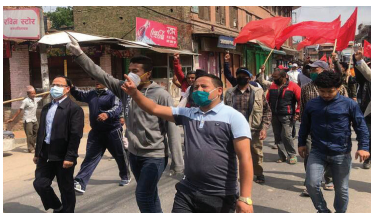
जोगाउन एक ठाउँ उभिनपुग्ने पनि धारणा राखेका छन्। प्रतिनिधिसभा र राष्ट्रियसभा सभामा