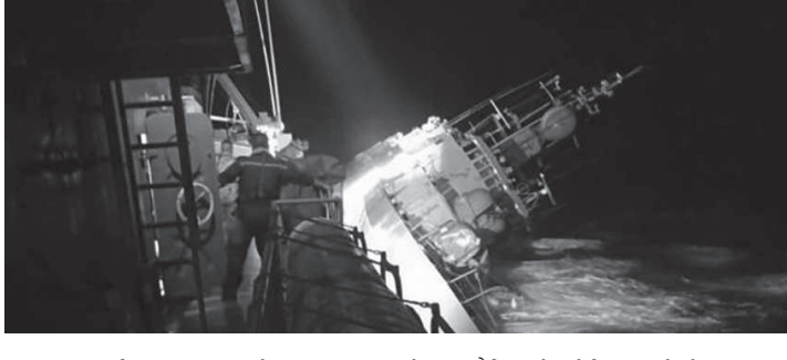
कम्तीमा नाविकहरूमा एक जनाको डुब्नु देखिएको देखिएको छ। नौसैनिकहरूमा जहाजले कडा छाल पार गर्ने

काठमाडौं/एजेन्सी- थाइल्याण्डको दक्षिणपूर्वी तटमा सोमवार डुब्दा डुब्दा कम्तीमा ३१ जना नौसैनिक बेपत्ता भएको नौसैनिकका प्रवक्ताले बताएका छन्। एचटीएमएस सुखोथाईले थाइल्याण्डको खाडीमा राखी गरिरहेको बेला दक्षिणी प्राञ्चल खिरी खानको बाड सफान किनारबाट करिब २० नौटिकल माइल टाढा जहाजको इलेक्ट्रोनिक प्रणालीमा क्षति पुगेपछि उद्धार अभियान सुरु गरिएको थियो।