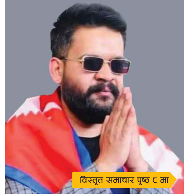
विस्तृत समाचार पृष्ठ ८ मा