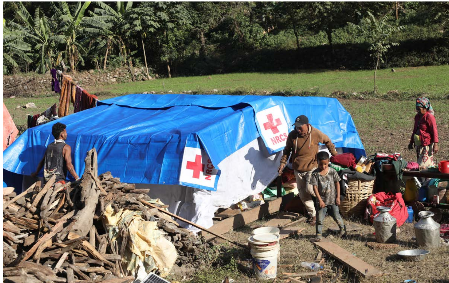
जाजरकोट भूकम्पबाट बढी प्रभावित भएको मध्ये एक पश्चिम रुकुमको आठबिसकोट नगरपालिका क्षेत्रमा भूकम्प पीडितलाई नेपाल रेडक्रस सोसाइटीले दिइएको पालबाट रात बिताउने ठाउँ बनाउँदै स्थानीय ।