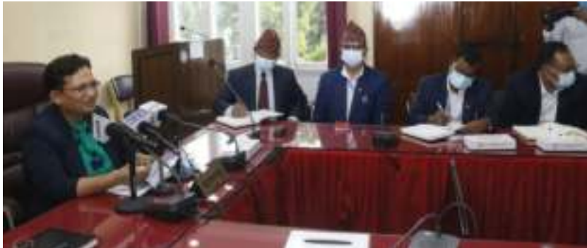
काठमाडौं, २७ साउन ।

ऊर्जा, जलस्रोत तथा सिंचाइमन्त्री पम्फा भुसालले २० युनिटसम्म खपत गर्ने विपन्न वर्गको ग्राहकहरूलाई निःशुल्क विद्युत् उपलब्ध गराउने घोषणा गरेकी छन्। बुधवार सिंहदरवारमा पत्रकार सम्मेलन गर्दै उनले विपन्न वर्गलाई निःशुल्क विद्युत् उपलब्ध गराउने सम्बन्धमा नेपाल विद्युत् प्राधिकरण सञ्चालक समितिले निर्णय गरिसकेको र छिट्टै कार्यान्वयनमा ल्याइने बताइन्।