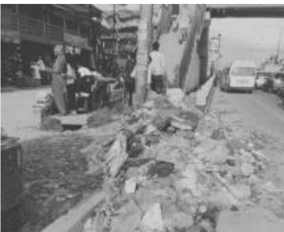
दिपेन्द्र श्रेष्ठ/मध्याह्न मत्तपुर, २७ साउन

भक्तपुरको मध्यपुर ठिमी-३ मा निषेधाज्ञादेखि नउठेको फोहोर अहिलेसम्म पनि उठेको छैन। लामो समयदेखि फोहोर नउठेपछि बजार क्षेत्र दुर्गन्धित बनेको हो। स्थानीय व्यापारिहरूका अनुसार फोहर निषेधाज्ञा देखिको हो, निषेधाज्ञा हुनु अगाडी नगरको फोहोरको गाडी आएर उठाएर लैजाँच्यो अहिले धेरै भैसक्यो फोहोरको गाडी गुडेको छैन।