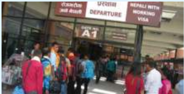
देखिएको बताएको छ।

उक्त संस्थाले कोरोना महामारीको विश्वव्यापी संक्रमणपछि रोजगारी गुमाएर घर फर्किएका कामदारहरूले वाध्यतावश आफूले कम्पनीबाट पाउनुपर्ने रकम छोड्नु परेको