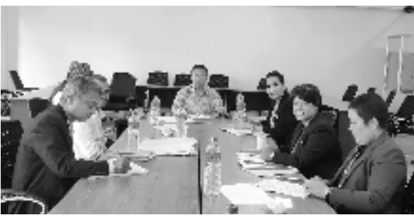
दीवस ढकाल/मध्यान्ह काठमाडौं, २९ साउन

अखिल नेपाल फुटबल संघ एन्फाको विवाद समाधान समितिले बुधवार पनि विभिन्न व्यक्तिकहरूसँग बयान लिएको छ।