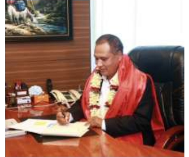
मध्यान् काठमाडौं, २७ साउन ।