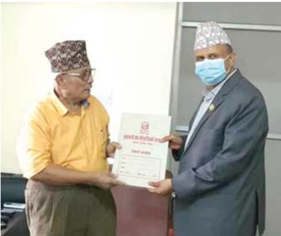
मुकुन्द लामिछाने / मध्यान् काठमाडौं, २७ साउन ।

प्रधानमन्त्री र दुई मुख्यमन्त्री गुमाइसकेको नेकपा एमालेले दुई प्रदेशमा सरकार बनाउने अवसर गुमाएको थियो। अझै पनि एमालेको संकट र क्षति रोकिएन संकेत देखिँदै।