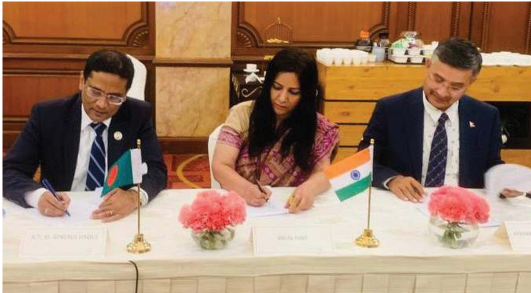
नारायण अर्याल/मध्याह्न काठमाडौं, २५ फागुन ।

बीबीआइएन मोटरवाहन सम्झौता (बीबीआइएन एमभीए) कार्यान्वयन गर्न नेपाल, भारत र बंगलादेशले अवधारणापत्रलाई अन्तिम रूप दिएका छन् । फागुन २३ र २४ गते भारतको राजधानी दिल्लीमा बसेको त्रिदेशीय बैठकमा तीन देशले सो सम्झौतालाई अन्तिम रूप दिएका हुन् । तर उक्त बैठकमा भुटान भने बैठकमा पर्यवेक्षकको