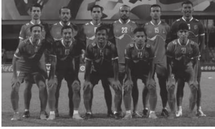
मध्यान्ह संवाददाता काठमाडौं, २५ फागुन