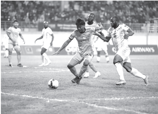
मध्याह्न संवाददाता काठमाडौं, ११ मंसिर

शहीद स्मारक ए डिभिजन लिगमा मनाङ मर्यादितरीले हिमालयन शेर्पालाई १-० गोल अन्तरले हराउँदै लगातार दोस्रो जित हात पारेको छ। खेलको ८४ औं मिनेटमा अफ्रिकी स्ट्राइकर ओलावाले अफजले पुजन उपरकोटीको कर्नर बलमा गोल गर्न सफल भए।