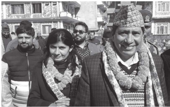
सदस्यको स्थानमा निर्वाचन हुन लागेको हो ।

निर्वाचनका लागि मुलुकका सातै प्रदेशमा आइतबार भएको उम्मेदवारी मनोनयन पत्र दर्ता शान्तिपूर्ण रूपमा सम्पन्न भएको निर्वाचन आयोगका सहायक प्रवक्ता सूर्यप्रसाद गौतमले जानकारी दिए । विहान १० देखि अपराह्न ३ बजेसम्म उम्मेदवारी मनोनयन दर्ता कार्यक्रम सञ्चालन भएको थियो । आगामी फागुन २० मा दुईवर्षे कार्यकाल पूरा गर्ने नेपाल कम्युनिष्ट पार्टी (नेकपा)का नौ, नेपाली कांग्रेसका सात, राजपाका दुई र समाजवादी पार्टीका एक