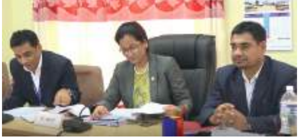
आम्दानीको १० प्रतिशत रकम अनिवार्य बुवा-आमाको खातामा जम्मा गरिनु पर्ने प्रावधान राखिएको थियो। यो प्रवधान हटाए पनि जेष्ठ नागरिकको जीवनयापनमा समस्या देखिएको खण्डमा आवश्यक रकम सन्तानबाट लिइ जेष्ठ नागरिकहरूको हेरचाहका लागि उपलब्ध गराउन सक्ने व्यवस्था गरिएको छ।

जेष्ठ नागरिक सम्बन्धी ऐन (पहिलो संशोधन) विधेयक २०७६ प्रतिनिधि सभाअन्तर्गतको महिला तथा सामाजिक समितिबाट सर्वसहमतिले पारित भएको छ। आइतबार सिंहदरबारमा बसेको समितिको बैठकले मुख्य चासोको विषय नै हटाएर पारित गरेको हो। सरकारले संशोधन गरेको विधेयकमा कुल आम्दानीको १० प्रतिशत रकम आमा-बुवाको खातामा जम्मा गर्नुपर्ने प्रावधान रहेको थियो। तर, समितिले कार्यन्वयन गर्न समस्या पर्ने र व्यवहारिक नहुनेभन्दै सर्वसहमतिले हटाएको हो। सरकारले अघि सारेको प्रवधानअनुसार नै पास भएको भए सन्तानले आफ्नो आमा-बुवाको जीवीकीर्णजनको लागि आफ्नो