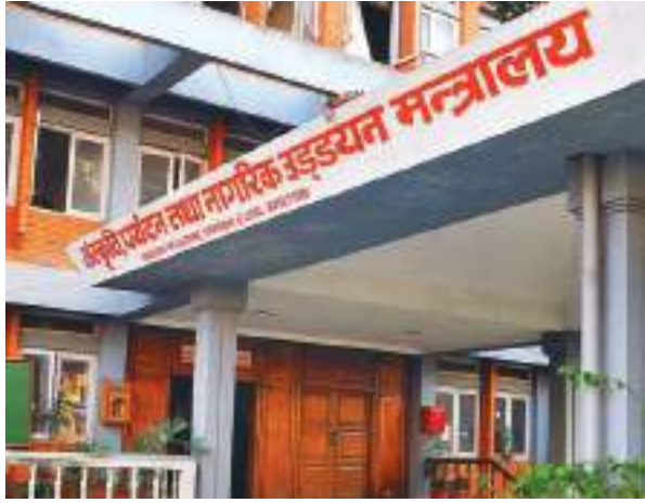
सहमति लिन केही ढिला गरिएको हो। तर, सहमति नभए पनि भाडा समायोजन गरिन्छ' मन्त्रालयका ती अधिकारीले भने।

भ्रमण वर्षको शुभारम्भ अगाडि नै हवाई भाडा समायोजन गर्ने जनाएको संस्कृति, पर्यटन तथा नागरिक उड्डयन मन्त्रालयले केही दिन ढिला गरी पुनः भाडा समायोजनको तयारी गरेको छ। निजी वायुयानहरूले असहमति जनाए पनि मन्त्रालयले पहिलो चरणमा सुगम, दोस्रो चरणमा पहाडी क्षेत्रमा भाडा समायोजनको तयारी गरेको मन्त्रालयका एक अधिकारीले जानकारी गराए। 'हामी अलि पहिलेदेखि नै भाडा समायोजनको तयारीमा रहेका छौं, निजी क्षेत्रको पनि सहमति लिन केही ढिला गरिएको हो। तर, सहमति नभए पनि भाडा समायोजन गरिन्छ' मन्त्रालयका ती अधिकारीले भने।