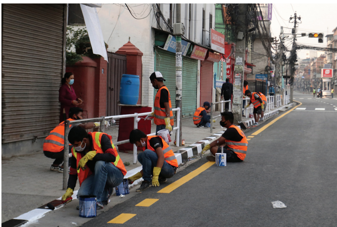
सुनसान तर, चिट्ठकः कोरोना महामारी रोकथामका लागि सरकारले गरेको चैत ११ गतेदेखि देशव्यापी लकडाउनको घोषणा गरेको छ। यो अवधिमा घर बाहिर ननिस्कन सरकारले आग्रह गरिरहेकाले राजधानी उपत्यका शहर सुनसान छ। तर, यसैबेला राजधानी सिगार्ने क्रम पनि तीव्र पारिएको छ।