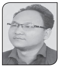
● निष्पु थिङ

पै दलयात्री मानव, समाज, प्रकृति र पर्यावरणमैत्री हुन्। यो प्रदुषणरहित भएको हुनाले यात्राको लागि उपयुक्त विकल्प हुन्। पैदलयात्री आफैँमा स्वास्थ्यको दृष्टिकोणले पनि लाभदायक छ। विभिन्न रोग लागेका रोगीहरूलाई चिकित्सकले दिने पहिलो सल्लाह नै विहान-बेलुका हिंडुल गर्नु, सकेसम्म पैदलै हिंड्नु। मध्यमेह, वायु, नशालगायतका अधिकांश रोगीहरूलाई चिकित्सकले दिने सल्लाह नै यहि हुन्।