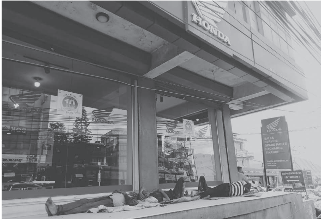
विशेषज्ञाका अन्योलतासँगै काम नपाएर काठमाडौं महाराजगञ्जको रोहिनी सदनको पेटिमा सुतिरहेका मजदुर (भरिया)।