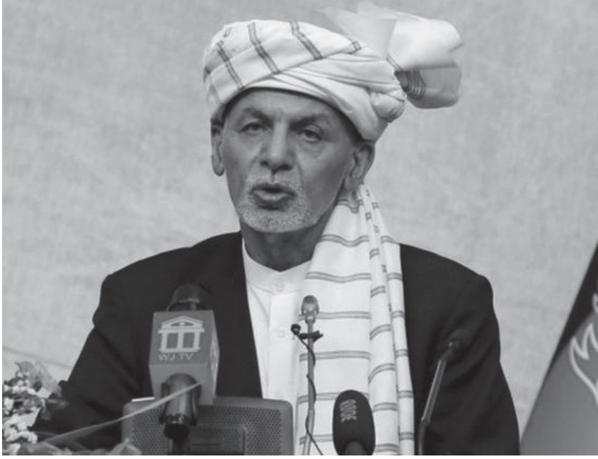
अफगान सरकारको आलोचना गरेका छन्। गएको सोमवारको सम्बोधनमा बाइडेनले आवश्यक परेका बेला समस्याको सामना गर्नु पर्नेमा देश छोडेर भागेको भन्ने घानीसहितका नेताको आलोचना