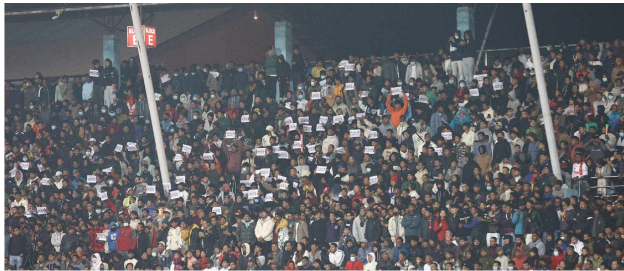
शुक्रबार ललितपुरको बालकुमारीमा मारिएका दुई युवकप्रति दशरथ रंगशालाबाट श्रद्धाञ्जली दिँदै फुटबलका समर्थकहरू । फोटो स्रोत: नेपालसबर ।