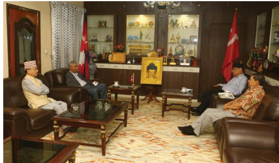
प्रधानमन्त्री शेरबहादुर देउवा मंगलबार माओवादी केन्द्रका अध्यक्ष पुष्पकमल दाहाल प्रचण्डसहित नेताहरूसँग ।

पाँच दल र त्यो भन्दा बढी घटकका सांसदहरूबाट विश्वासको मत पाएका प्रधानमन्त्री शेरबहादुर देउवा सत्ता समीकरण गिलाउन नसक्दा पाँच सदस्यीय मन्त्रपरिषद्लाई पूर्णता दिन सकिरहेका छैनन् । तर राजनीतिक दौडधुप बने बावलो छ ।