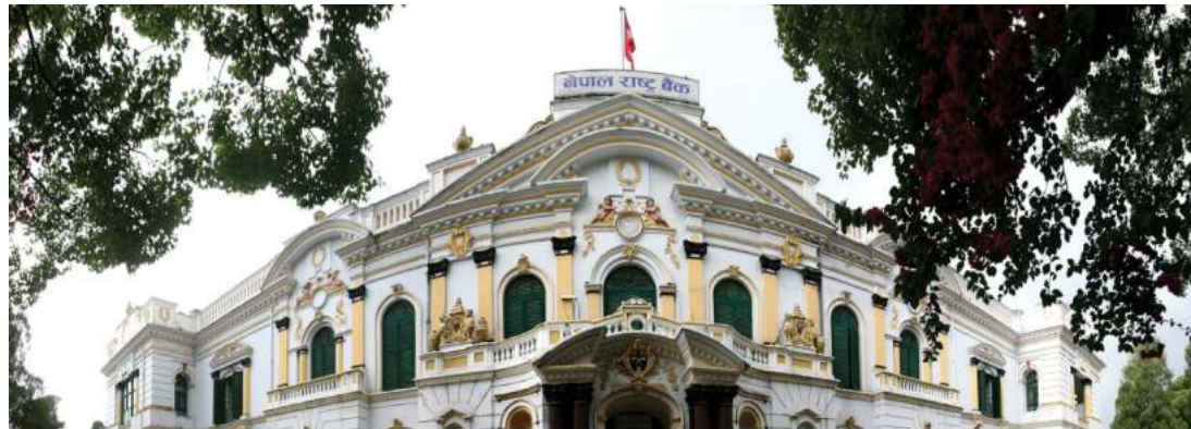
सागर तिमल्सिना/मध्यान्ह काठमाडौं, ५ साउन ।

नेपाल राष्ट्र बैंक मौद्रिक नीति सार्वजनिक गर्ने अन्तिम तयारीमा जुटेको छ । पूर्वनिर्धारित समय गुजिसकेको कारण नीति सार्वजनिकको दबावमा परेको राष्ट्र बैंक यहि साताभित्र सार्वजनिक गर्ने गरि तयारीमा जुटेको हो ।