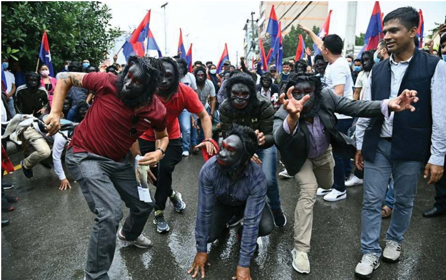
मंगलबार बानेश्वरमा नेकपा प्छाले निकट युवा संघ नेपालले निकालेको बाँदर जुलुस । युवा संघका कार्यकर्ता अनुहारमा बाँदरको मुकुटसहित प्रदर्शनमा निस्किएका थिए ।