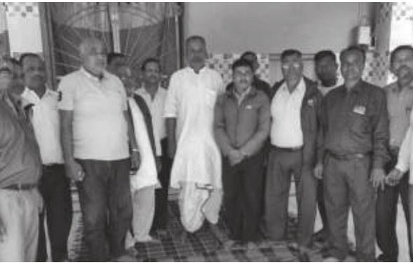
कमला भट्टराई/मध्यान्ह भाषा, २६ कात्तिक

विश्वभर पनै लिएको कोरोना भाइरस (कोभिड-१९) को महामारीका कारण नेपाल-भारत सीमा नाका बन्द हुँदा सीमा क्षेत्रमा बसोबास गर्ने नेपाल भारत दुवै तर्फका नागरिकहरूको जनजीवन प्रभावित भएको छ। सो विषयमा शुक्रवार प्रदेश नं १ अन्तर्गत भाषामा भारतीय सिमा क्षेत्र दिघल बैकमा नेपाल भारत तर्फका स्थानीय बुद्धिजीवी, पत्रकार, राजनीतिक व्यक्तित्व, र व्यापारीहरूको बैठक सम्पन्न भएको छ।