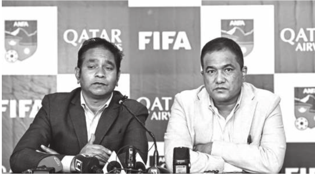
मध्यान्ह संवाददाता काठमाडौं, २६ कात्तिक

शहीद स्मारक ए डिभिजन लिग फुटबल हेतिका लागि दर्शकहरूले टिकट काटनु पर्ने भएको छ। कोरोना महामारीका कारण गत सिजन ए डिभिजन लिग हुन सकेको थिएन। यसपटक रेलिगेशनसहितको लिग मंसिर ३ गतेदेखि शुरु हुँदै छ। ए डिभिजन लिगका लागि अखिल नेपाल फुटबल संघ एन्फाले टिकटको मूल्य सार्वजनिक गरेको छ। शुक्रवार भएको पत्रकार सम्मेलनमा त्रिपुरेश्वरस्थित दशरथ रंगशालामा हुने प्रतियोगितामा