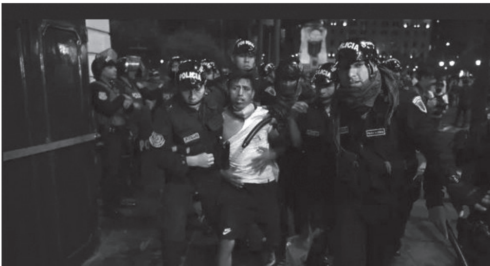
साइटको प्रवेशद्वार कस्कोको एयरपोर्ट, विरोध प्रदर्शनको कारण बन्द भएर शनिबार फेरि खुला भएको छ। प्रदर्शनकारीहरूले यातायातमा पुग्ने प्रयास गरेपछि अधिकारीहरूले विहीवार देशको दोस्रो सबैभन्दा ठूलो हवाई यातायात ह्यान्डल गर्ने एयरपोर्टमा रोकथाम उपायको रूपमा सञ्चालन निलम्बन गरेका छन्।

काठमाडौं/एजेन्सी- पेरुको सरकारले हालैका हप्ताहरूमा कम्तीमा ४२ जनाको ज्यान लिने राष्ट्रपति डिना बोल्भार्तेविरुद्धको प्रदर्शनका कारण राजधानी लिमा र अन्य तीन क्षेत्रहरूमा आपतकालिन अवस्थाको घोषणा गरेको छ। तीस दिनको लागि लागू हुने गरी सेनालाई व्यवस्था कायम राख्न हस्तक्षेप गर्न अधिकार दिइएको छ। आन्दोलन र भेलाको स्वतन्त्रता जस्ता धेरै संवैधानिक अधिकारहरू निलम्बन गरेको प्रकाशित एक आदेश जनाइएको छ। अपदस्थ राष्ट्रपति पेद्रो कास्टिलोका समर्थकहरूले डिसेम्बरदेखि दक्षिण अमेरिकी देशभर सडकमा च्याली र नाकाबन्दी गरेका छन्, नयाँ चुनाव र बोल्भार्तेलाई हटाउन माग गर्दै आन्दोलन जारी राखेका छन्। 'मेरो प्रतिबद्धता पेरुसँग छ' शुक्रबार राति उनले टेलिभिजन सम्बोधन गर्दै राजीनामा दिन अस्वीकार गरेका छन्। आपतकालिन अवस्थाले लिमा, कस्को र पुनोका क्षेत्रहरू, साथै राजधानीको छेउमा रहेको कालाओ बन्दरगाहलाई समेटेको छ।