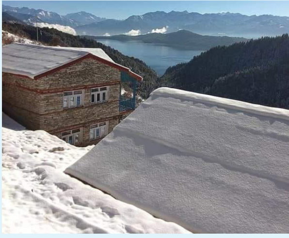
लुगुको सारास्थित राया ग्लिजे रिपोर्टमा हिउँ पर्वको दृश्य ।