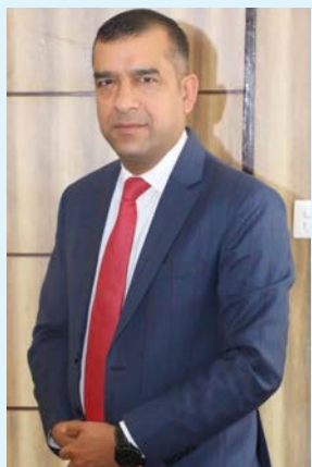
मध्यान्ह संवाददाता काठमाडौं, २० माघ ।