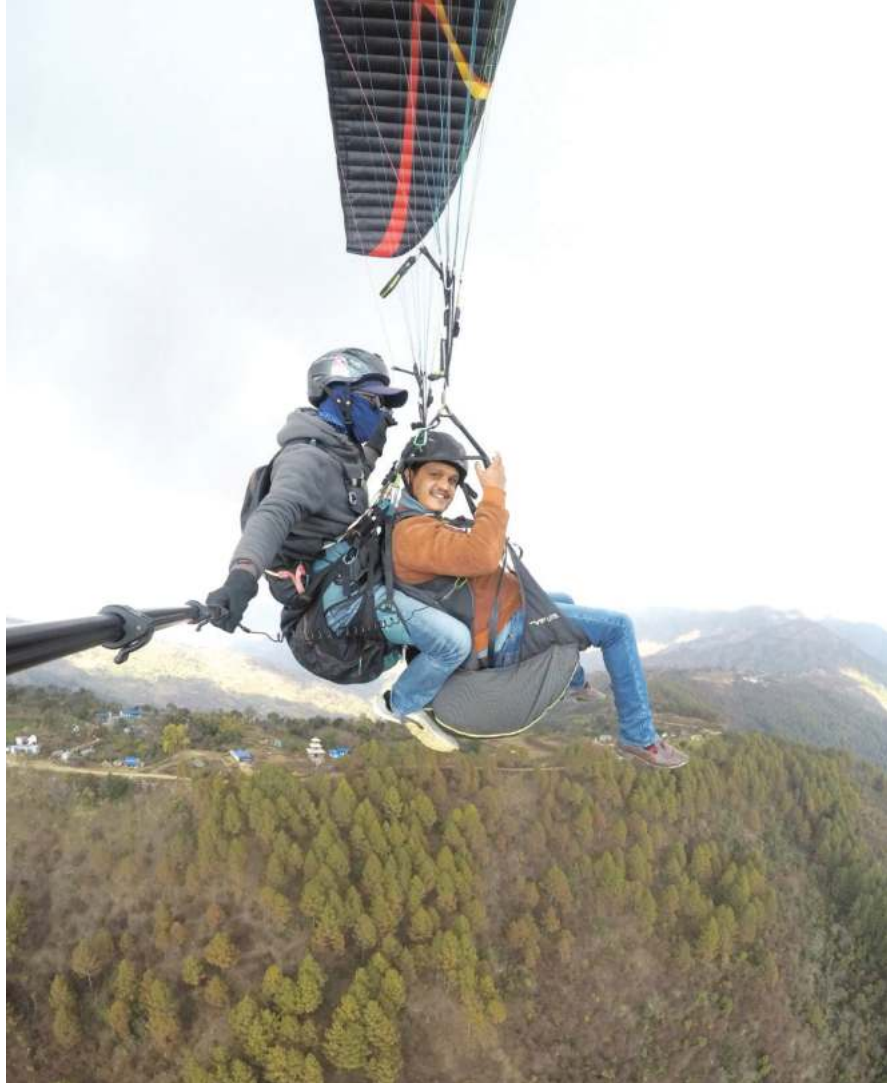
आन्तरिक आकर्षण: कर्णाली प्रदेशको राजधानी वीरेन्द्रनगर सुर्खेतमा प्याराग्लाइडिङ गर्दै आन्तरिक पर्यटक ।