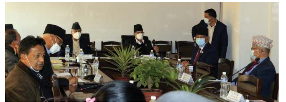
सभामुखले सोमबार बोलाएको सर्वदलीय बैठकमा शीर्ष नेताहरू ।

'एमसीसीका सम्बन्धमा अम्पाएर मात्रै न हो । दलहरू सहमत भए म रोकिदैन', सभामुख सापकोटाले भने । सभामुख