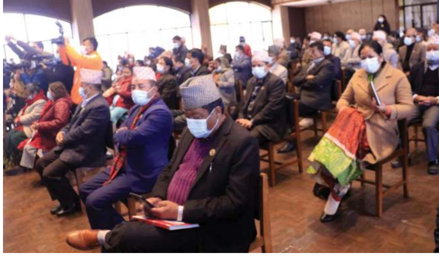
सोमबार संसद भवनमा बसेको एमाले संसदीय दलको बैठकमा सहभागी सांसदहरू ।

आफ्नो स्वार्थ पूरा नभएपछि सत्ता गठबन्धनले प्रधानन्यायाधीश चोलेन्द्र शमशेर जबरविरोद्ध महाअभियोग लगाएको निष्कर्ष निकालेको एमालेले बाँकी चार न्यायाधीशलाई महाअभियोग लगाउने तयारी बढाएको छ । अर्थात् यो प्रतिशोधको राजनीतिले न्यायालय थप संकटग्रस्त जाने स्वतन्त्र बढेको छ ।