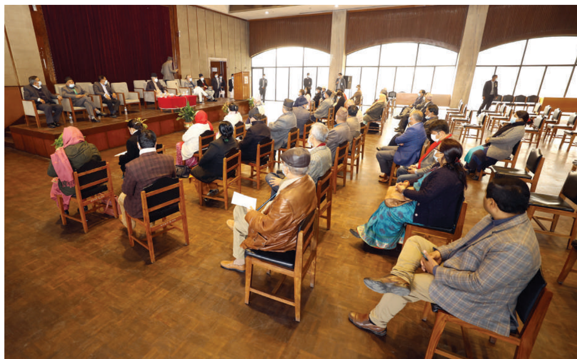
बालेश्वरस्थित संसद् भवनमा मंगलबार बसेको नेपाली काँग्रेस संसदीय दलको बैठकमा सांसदहरू ।

सरकारको नेतृत्व गरिरहेको दल नेपाली काँग्रेसले अमेरिकी सहयोग परियोजना एमसीसी अनुमोदन गर्ने पक्षमा निर्णय गरेको छ । तर बाँकी दलहरूले भने प्रष्ट निर्णय गरेका छैनन् ।