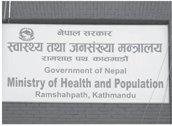
जानकारी दिएको छ। गत २४ घण्टाको अवधिमा देशका विभिन्न ठाउँमा गरी २ जना कोरोना संक्रमितको मृत्यु भएको छ। कोरोना

काठमाडौं/मस- नेपालमा थप ६८० जनामा कोरोना भाइरसको संक्रमण पुष्टि भएको छ। गत २४ घण्टामा एन्टिजेन र पीसीआर प्रविधिबाट देशभर ७ हजार ९५ नमूनाको परीक्षण हुँदा मंगलबार ६८० जनामा संक्रमण पुष्टि भएको स्वास्थ्य तथा जनसंख्या मन्त्रालयले जानकारी दिएको छ। गत २४ घण्टामा ४ हजार २५६ जनाको पीसीआर र २ हजार ८२९ जनाको एन्टिजेन परीक्षण भएको मन्त्रालयले जानकारी दिएको छ। एन्टिजेन परीक्षणको तथ्याङ्कमा एसएमएस र ईमेलबाट प्राप्त नतिजाको विवरण समेत समावेश गरिएको छ। पीसीआर परीक्षणबाट ४९८ जनामा र एन्टिजेन परीक्षणबाट १८२ जनामा संक्रमण पुष्टि भएको मन्त्रालयले