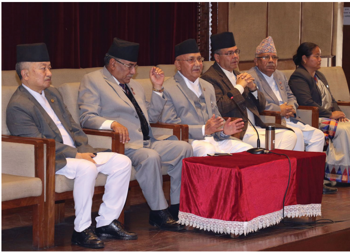
मध्यान् संवाददाता काठमाडौं, १५ वैशाख

नेकपा अध्यक्ष एवम् प्रधानमन्त्री केपी शर्मा ओली निकट नेताहरूले बरिष्ठ नेता माधवकुमार नेपाल निकट नेताहरूसँग सचिवालय बैठक राखेर स्थायी कमिटी बैठकको मिति तय गर्न सहमति जनाएका छन्। प्रधानमन्त्री ओली र नेता नेपाल बीच बालुवाटारमा भेटवार्ता भएपछि कोटेश्वरमा दुवै पक्षका नेताहरू छलफलमा बसेका थिए।