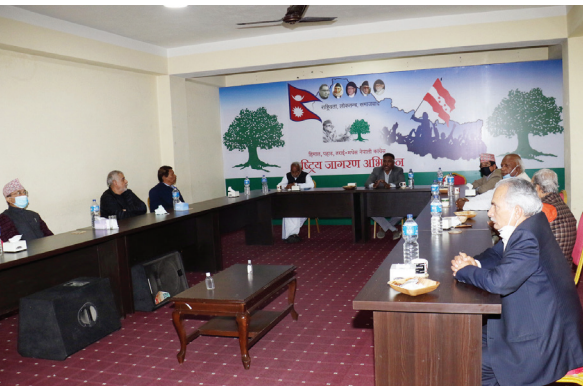
प्रमुख प्रतिपक्षी दल नेपाली कांग्रेसको अग्रसरतामा सङ्घीय संसदमा प्रतिनिधित्व गर्ने विपक्षी दलहरूको नेपाली कांग्रेस केन्द्रीय कार्यालय, सानेपामा सोमबार बसेको बैठक।