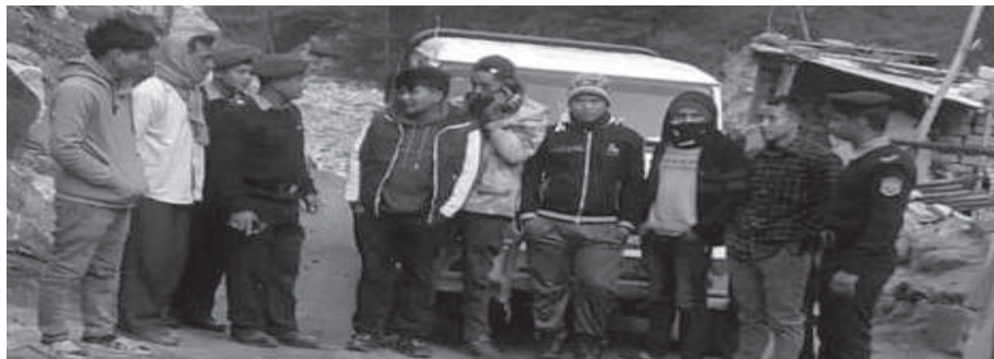
नविन अंक्र मध्याह्न मनाङ, १७ फागुन

मनाङमा सवारी साधन आवागमन हुने समय भएपछि सडक सवारी तथा ट्राफिक नियमसम्बन्धी सचेतना कार्यक्रम मूलक कार्यक्रम गरिएको छ।