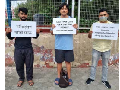
समर्थकहरूसँग ई: (वीचीमा) ।

अस्मिता बम / मध्यान्ह काठमाडौं, ७ असोज । अभियन्ता ई: को एक सातादेखि आन्दोलनमा छन् । प्रदर्शनीमार्ग स्थित राष्ट्रिय सभा गृह परिसरमा अविश्राम उभिइरहेका ई: को आन्दोलनमा समर्थन गर्नेहरू पनि बढिरहेका छन् । ई: को शान्तिपूर्ण आन्दोलनमा आइतवार