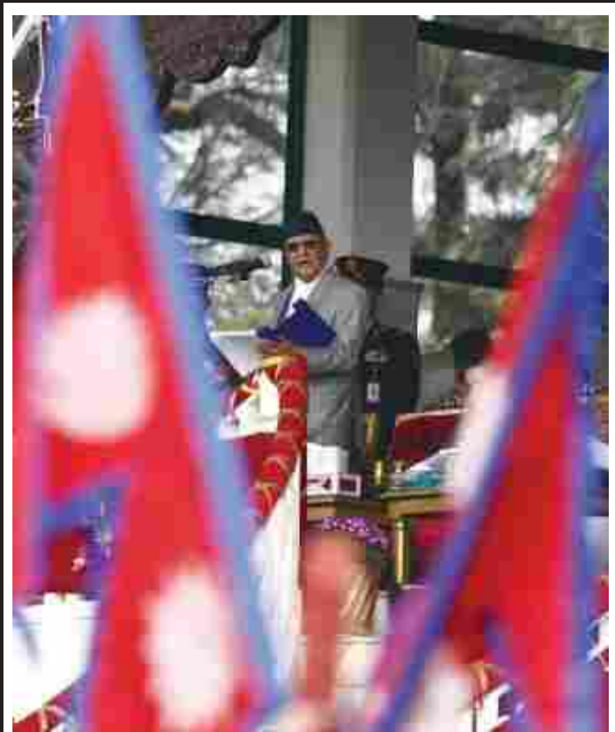
उत्सवमा प्रधानमन्त्री: ७०औं प्रजातन्त्र दिवस देशभर विशेष उत्सवका साथ मनाइएको छ । दुईखेलमा नेपाली सेनाले विशेष भौकी सहित आयोजना गरेको समारोहमा राष्ट्रपति, प्रधानमन्त्री, सभामुख लगायत विशिष्ट व्यक्तिहरूलाई निमन्त्रण गरिएको थियो ।