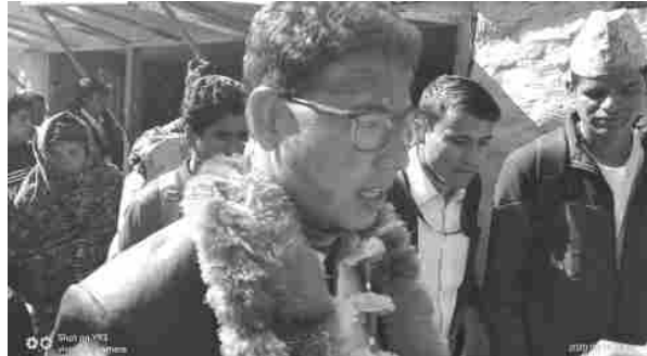
कर्ण कुमाल/मध्याह्न कालिकोट ७ फागुन

कालिकोट जिल्लाको अत्यन्तै विकट मानिने पलाँता गाउँपालिकाका विकास निर्माण र पलाँताको समृद्धिमा एकपछि अर्को गर्दै पाइला अगाडि चलि रहेको छ। संघीय संरचना अनुसार स्थानीय सरकार आएपछि जिल्लाको विकट पलाँता भनेर चिनिने पलाँता गाउँपालिकाको मुहार फेरिदै गएको छ। जिल्लाका ९ वटै पालिकाले विकास निर्माणका कार्यमा पहिलो प्राथमिकता सडकलाई दिने गरेका छन्। पलाँता गाउँपालिकाका स्थानीय तथा जनप्रतिनिधिहरु पनि नागरिकको समस्यालाई मध्यनजर गर्दै पलाँताको विकासका लागि प्रतिबद्ध भएर अघि बढेका छन्।