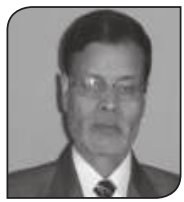
● उपेन्द्र भा

तोडी दिने। यस प्रकार चीनसँग पनि कूटनीतिक सम्बन्ध मधुर छैन। भारतको विरोध गरेर चीनसँग असीमित स्वार्थ लाभ प्राप्त गर्ने तत्कालीन प्रधानमन्त्री केपी शर्मा ओलीको हास्यास्पद राजनीतिक अभिनय कसैबाट लुकेको छैन। दुई तिहाईको बहुमत पनि चीनकै कपाले प्राप्त भयो। भारतविना पनि तेश्रो मुलुकबाट सामान ल्याएर देखाउन सक्ने वीर साहसी प्रधानमन्त्री केपी शर्मा ओलीले पछि चीनको गहिरो विश्वासलाई तोड्दै भारतसँग सम्बन्ध मधुर बनायो। केपी शर्मा ओली मातृ संस्थामा फर्केपछि चीनले नेपालको कम्प्युनितलाई बडो तीखा व्यंग्य गरेको थियो। नेपालमा चीनले विश्वास गर्ने एउटा पनि कम्प्युनित नरहेको अवस्थामा त्यो विश्वास उपेन्द्र यादवमाथि केन्द्रित भयो।