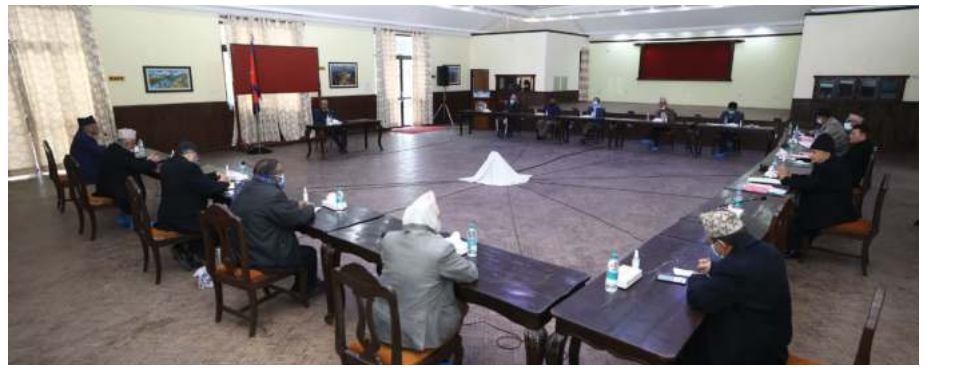
बालुवाटारमा शनिबार साँझ बसेको सत्ता गठबन्धनको बैठकमा सहभागी नेताहरू।