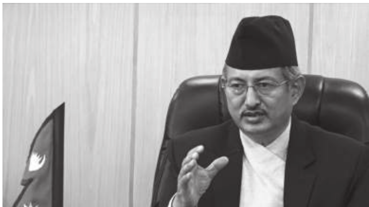
अग्रह गरे। पहाडमा जथाभावी खनेर बाटो बनाएका कारण जोखिम बढेको र

मुलुकका ७७ वटै जिल्लाका प्रमुख जिल्ला अधिकारी भर्चुअल माध्यमबाट जोडिएको कार्यक्रममा गृहमन्त्री खाँणले पुर्खाले अवलम्बन गर्दै आएका परम्परागत सीपको प्रयोग विपद् जोखिम न्यूनीकरणमा लगाउनसमेत अप्रग्रह गरे। गृहमन्त्री खाँणले भवन निर्माणको मापदण्ड पालना गर्न