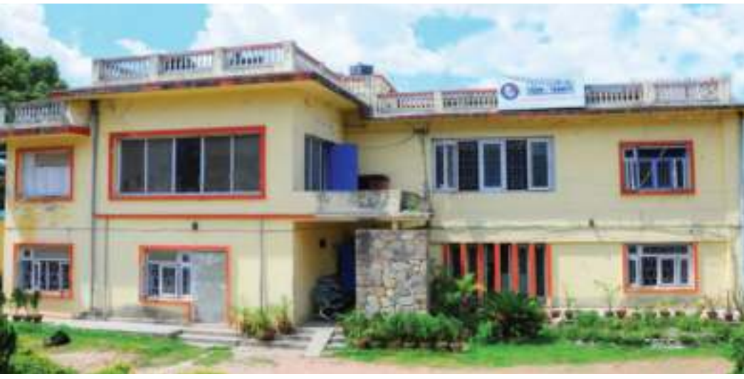
नारायण अर्याल/मध्याह्न काठमाडौं, १३ मंसिर

बीमा समितिको निर्देशनपश्चात अब बीमा कम्पनीहरूले विदेशी पुनर्बीमा कम्पनीसँग व्यवसाय गर्न सक्नेछैनन् । बीमा समितिको उक्त निर्णय कार्यान्वयन भएमा अब पुनर्बीमा बापत वर्षेनी रुपमा बाहिरिने अरबौं बराबरको रकम अब बाहिरिने छैन । जसले गर्दा विदेशी मुद्राको सञ्चितमा बृद्धि हुनेछ ।