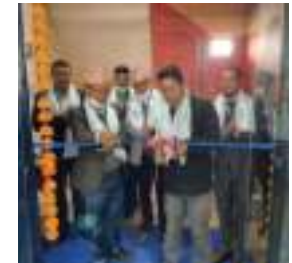
मध्यनजर गर्दै अत्याधुनिक सुविधा सम्पन्न कार्यालयद्वारा

काठमाडौं/मस- कामना सेवा विकास बैंक लिमिटेडले एकै दिनमा दुईवटा शाखा विस्तार गरेको छ । बैंकले नवलपरासी, सुस्ता पूर्व जिल्ला देवचुली नगरपालिकाको वडा नं. १५ प्रगतनगर र कावासोती नगरपालिका वडा नं. १६, डण्डा स्थित एकै दिनमा दुईवटा शाखा कार्यालय विस्तार गरेको हो । गाहकहरूको सुविधालाई