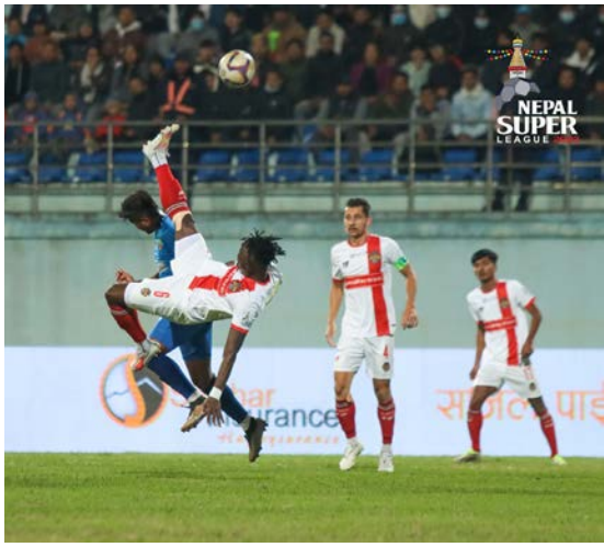
३८औं मिनेटमा करीमको बक्सको बायाँ हातबाट लिएको फ्रीकिक प्रहार फार-पोस्टको केही टाढाबाट बाहिरियो। ४३औं

काठमाडौं/मस- नेपाल सुपर लिग एनएसएलमा ललितपुर सिटी एफसी र पोखरा थन्डर्सले बराबरी खेलेका छन्। बुधवार त्रिपुरेश्वरस्थित दशरथ रंगशालामा ललितपुर र पोखराको गोलरहित बराबरी खेलै अंक बाँडेका हुन्। खेल अवधिभर दुवै टिमले अवसर सिर्जना गरेपनि गोल निकाल्न सकेनन्।